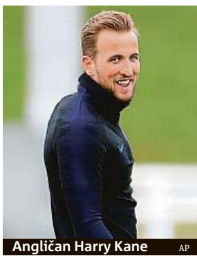
Angličan Harry Kane

Některé reprezentace už také hlásí ztráty klíčových hráčů. Belgiu bude chybět útočník Romelu Lukaku, Srbku Nemanja Matić a Švýcařům Xherdan Shaqiri.