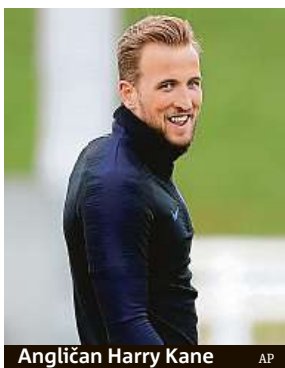
Angličan Harry Kane

Některé reprezentace už také hlásí ztráty klíčových hráčů. Belgiu bude chybět útočník Romelu Lukaku, Srbku Nemanja Matić a Švýcarsku Xherdan Shaqiri.