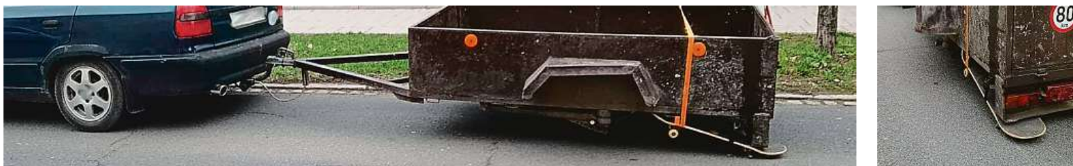
Policisté z Opavy se nestačili divit. Zastavili opilého šoféra, který si namontoval na svůj vozík skateboard. Navíc mělo auto kradenou SPZ.