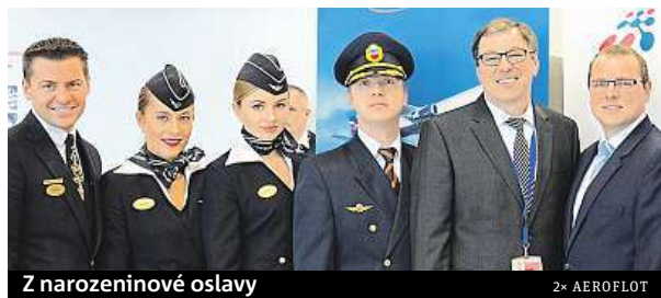
Z narozeninové oslavy

přichystán nejen dort, ale i malé občerstvení a šumivé víno na přípitek. Aeroflot si velmi váží spolupráce s Letištěm Praha a bylo pro nás ctí a potěšením společně oslavit naše kulaté narozeniny. Při příležitosti této malé oslavy bylo na linku SU 2010/SU2011 nasazeno stylové letadlo Aeroflotu Airbus A320 v historické „retro livery – Dobrolet“.