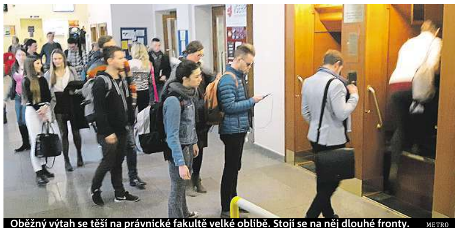
Oběžný výtah se těší na právnické fakultě velké oblibě. Stojí se na něj dlouhé fronty.