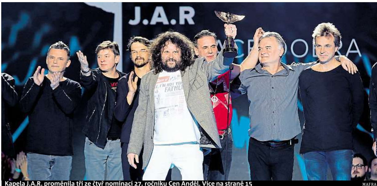
Kapela J.A.R. proměnila tři ze čtyř nominací 27. ročníku Cen Anděl. Více na straně 15

Jiná doba. Pojišťovny mění nabídku kvůli novým technologiím, profesím i chorobám. Psychické poruchy. Mohou končit i invalidním důchodem. Samoriditelná auta. Kdo odpovídá za jejich nehody STRANA 8