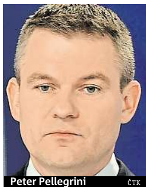
Peter Pellegrini

Tříčlenná koalice se dohodla na vytvoření nového kabinetu po demisi dosavadního