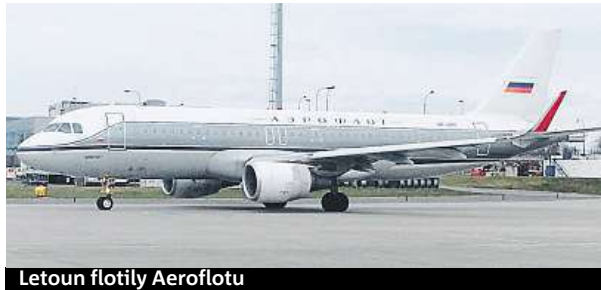
Letoun flotily Aeroflotu

Včera odpoledne, před odletem linky SU 2011, proběhla na Letišti Praha malá oslava 95. narozenin Aeroflotu.