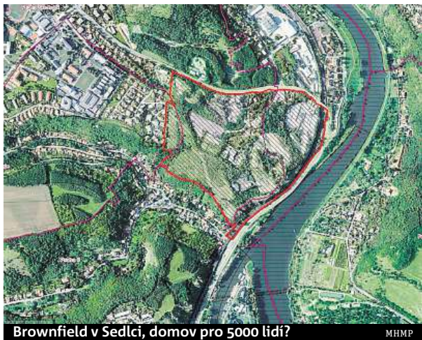
Brownfield v Sedlci, domov pro 5000 lidí?

„Tramvaj je důležitá pro univerzitu i pro obyvatele Suchdola. Proto chceme co nejdříve dosáhnout změn, které umožní tramvaj vyprojektovat,“ uvedla včera náměstkyně primátorky Petra