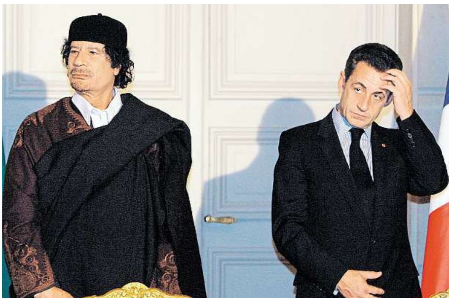
Libyjský vůdce Muammar Kaddáfí a Nicolas Sarkozy v prosinci 2007 v Elysejském paláci

Zpravodajský server Mediapart už v roce 2012 před dalšími volbami přišel s informací, že Libye poskytla na Sarko-