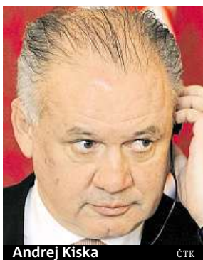
Andrej Kiska

Pellegrini Kiskovi předložil nový návrh dnes. Na ostře sledovanou funkci ministra vnitra navrhne dosavadního ministra zdravotnictví, nešťáka Tomáše Druckera. „V zájmu vyřešení této situa-