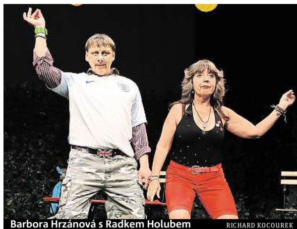
Barbora Hrzánová s Radkem Holubem