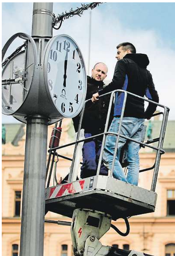
Při práci si hlídejte svůj čas.

Pokud zaměstnavatel neposkytne zaměstnanci náhradní volno v době 3 kalendářních měsíců po výkonu práce přesčas, nárok na náhradní volno zaniká a zaměstnanci