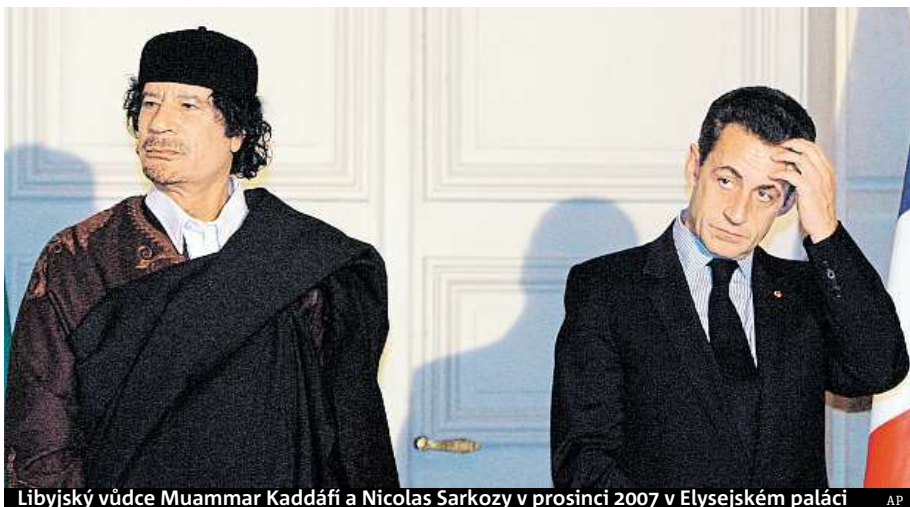
Libyjský vůdce Muammar Kaddáfí a Nicolas Sarkozy v prosinci 2007 v Elysejském paláci

Sarkozy volby v roce 2007 vyhrál a v letech 2007 až 2012 zastával post prezidenta. Nyní je podezříván, že přijal finanční podporu od režimu tehdejšího libyjského vůdce Muammara Kaddáfího. Expresident, jemuž hrozí žaloba za nedovolené použití peněz ze zahraničí a za nenařazení přesných výdajů na volební kampaně, vždy popíral, že by pochybil.