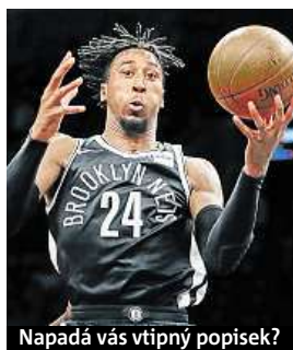
Napadá vás vtipný popisek?

Napište bublinu a reagujte na sloupek na: www.facebook.com/denikmetro