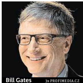
Bill Gates 3x