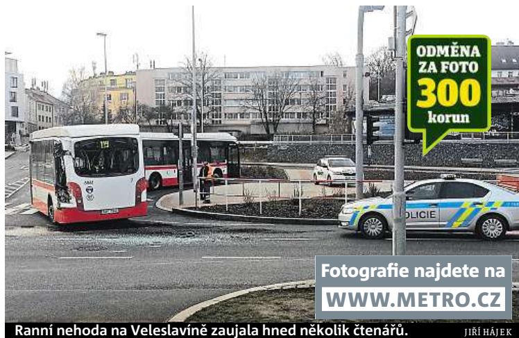
Ranní nehoda na Veleslavíně zaujala hned několik čtenářů. JIŘÍ HÁJEK

Jeden z nejdelších autobusů světa teď chvíli v Praze nevidíte.