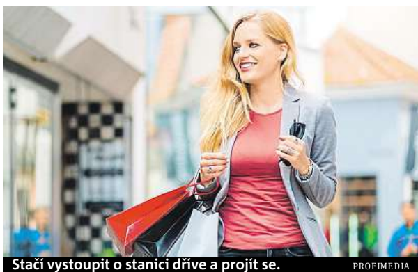
Stačí vystoupit o stanici dříve a projít se.

Chůze je pohyb, který je člověku od přírody nejpřirozenější. Proto si často myslí-