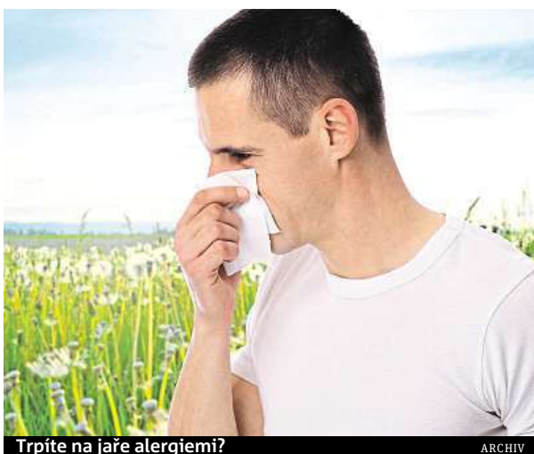
Trpíte na jaře alergiemi?