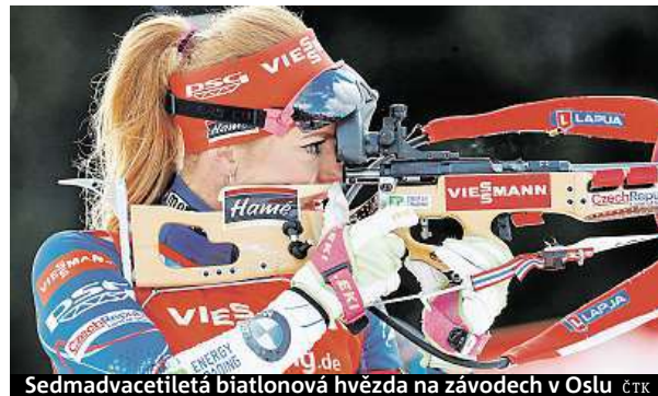
Sedmadvacetiletá biatlonová hvězda na závodech v Oslu

Za výkony ve Světovém poháru, do kterého se počítá i mistrovství světa, Koukalová získala přes 200 tisíc eur. Od českého svazu dostane na-