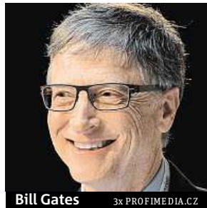
Bill Gates