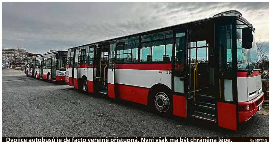
Dvojice autobusů je de facto veřejně přístupná. Nyní však má být chráněna lépe. 5x METRO

hle dvojka zaparkovaná asi čtrnáct dní. O tom, že tam lidé lezou, vím,“ vysvětlil nám „parkmistr“ s tím, že v lezení do autobusů neviděl problém. Myslel totiž, že jsou otevřené záměrně. „Když tu byla vystavená ta ukrajinská auta, také po nich lidé lezli,“ krčí rameny hlídač.