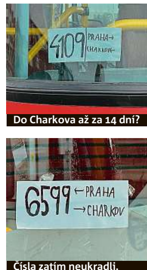
Čísla zatím neukradli.