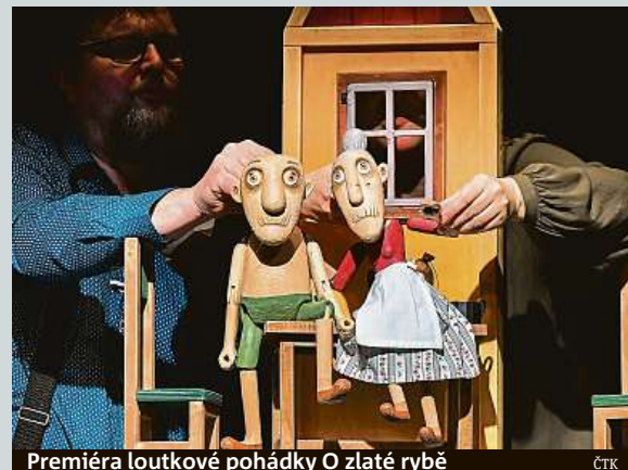
Premiéra loutkové pohádky O zlaté rybě ČTK