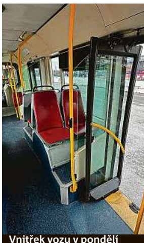
Vnitřek vozu v pondělí