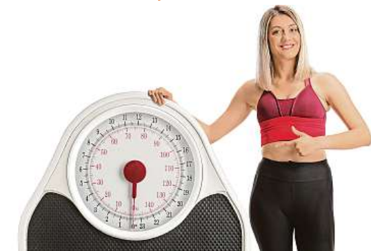
Při hubnutí je důležité jídlo a pohyb, ale i psychika.

Cílem snažení by se tedy neměla stát pouze rychlá redukce mnoha kilogramů, ale učení se tomu, jak si vytvořit chutný jídelníček, který bude splňovat zásady racionální výživy a z hlediska energetického bude takový, aby