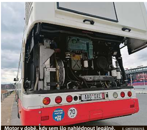
Motor v době, kdy sem šlo nahlédnout legálně. E. GMITTERKOVÁ

Deník Metro se na místo vypravil včera dopoledne. Jak jsme si na místě potvrdili, do vozů se dá skutečně poměrně snadno vlézt. Žádného nezvaného návštěvníka jsme zde však nepotkali. Několik postřehů na téma autobusů se nám podařilo dostat z hlídače parkoviště, na kterém autobusy stojí. Jeho budka je ale od vozů vzdálená asi sto padesát metrů, takže z ní není na busy příliš vidět. „Moje informace je taková, že tu bude ta-