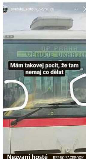
Nezvaní hosté