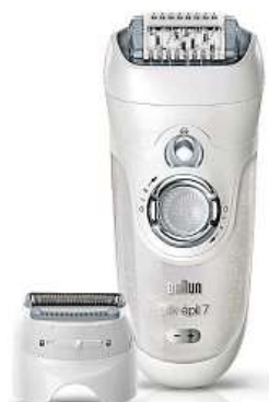
Braun Silk-épil 7-895

Výrobce Braun patří na poli elektrických epilátorů k naprosté špičce, což mimo jiné dokazuje přístrojem Braun Silk-épil 7-895.