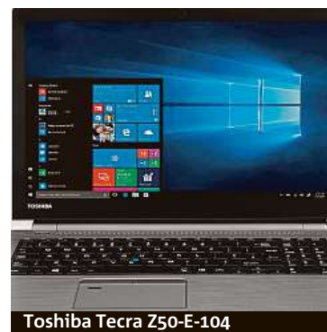
Toshiba Tecra Z50-E-104

Notebook Toshiba Tecra Z50-E-104 je ukázkou kombinace špičkového výkonu a chytré konstrukce. Na první pohled je vidět, že se nejedná o žádné křehké zařízení. Kvalitní IPS displej s rozlišením Full HD drží dvojice robustních pantů. O grafické výpočty se stará speciální čip s vysokým výkonem, nízkou spotřebou a minimálním zahříváním. Srdcem notebooku je 4jádrový procesor Intel Core i5-8250U, který je výkonově dostatečný i pro náročnější výpočetní operace. Bezproblémové a plynulé práci s notebookem napomáhá také