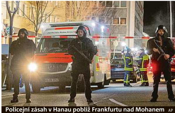
Policejní zásah v Hanau poblíž Frankfurtu nad Mohanem

stavy o světě. Podle serveru časopisu Der Spiegel v něm mimo jiné píše o tom, že Němci jsou národem, z něhož vyrůstá to nejlepší na světě, zatímco obyvatelé mnoha jiných zemí je potřeba vyhladit. Ministr vnitra Beuth také uvedl, že pachatel měl legálně drženu zbraň a byl sportovní střelec. Totožnost ani národnost obětí zatím úřady nezveřejnily. České ministerstvo zahraničí včera dopoledne na Twitteru uvedlo, že podle informací z českého velvyslanectví v Berlíně se tragédie českých občanů nedotkla. ČTK