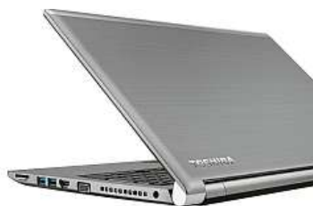
Notebook Toshiba Tecra 2x MIRONET

Na těle notebooku se nachází webkamera, přesný touchpad i čtečka otisků prstů. Strany notebooku jsou poseté konektory, mezi kterými nechybí ani HDMI, RJ-45 (LAN) nebo USB 3.0. Díky tomu je možné například externí pevný disk Toshiba Canvio Basics, který získáte u Mironetu s nákupem tohoto notebooku zdarma, bez problému připojit spolu s dalším příslušenstvím. Notebook Toshiba Tecra Z50-E-104 v Mironetu stojí 27 208 Kč a kromě externího pevného disku k němu získáte zdarma také praktický prodlužovací přívod PowerCube Extended USB. Pokud byste si rádi před nákupem tento notebook prohlédli, najdete ho vystavený na pobočkách Mironet Praha-Chodov a Mironet Brno.