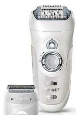
Braun Silk-épil 7-895

Výrobce Braun patří na poli elektrických epilátorů k naprosté špičce, což mimo jiné dokazuje přístrojem Braun Silk-épil 7-895.