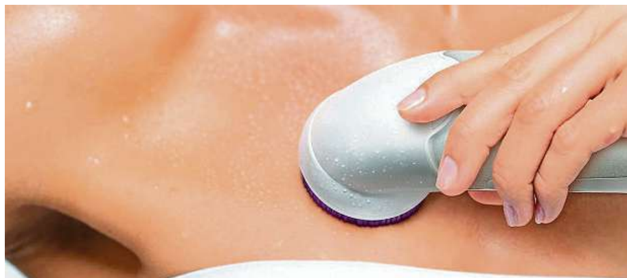
Epilátor Silk-épil má i mnohé chytré funkce.

Pokud jsou pro vás chloupky všech velikostí nepřitelem číslo jedna, máme pro vás tip na spolehlivý nástroj, který vás tohoto trápení zbaví.