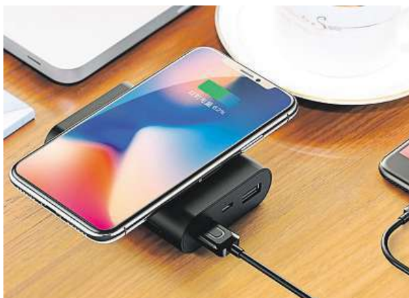
Bezdrátová přenosná nabíječka USAMS US-CD31

To, co ji dělá výjimečnou, je podpora bezdrátového na-