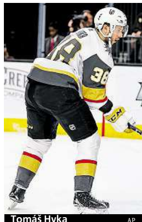
Tomáš Hyka