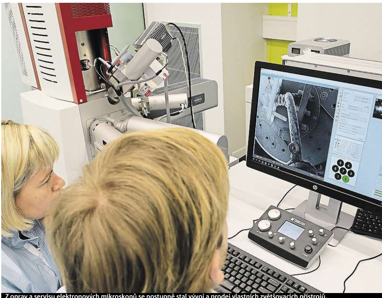
Z oprav a servisu elektronových mikroskopů se postupně stal vývoj a prodej vlastních zvětšovacích přístrojů.

fonů. Častými odběrateli jsou také univerzity. Elektronový mikroskop Tescan využívají například vědci a studenti z Oxfordu, Harvardu nebo Berkeley.