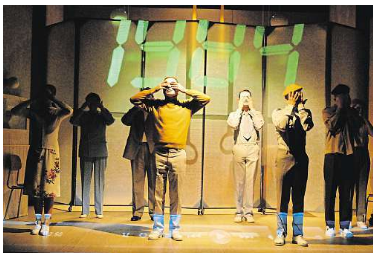
Divadlo Petra Bezruča a představení s názvem 1984