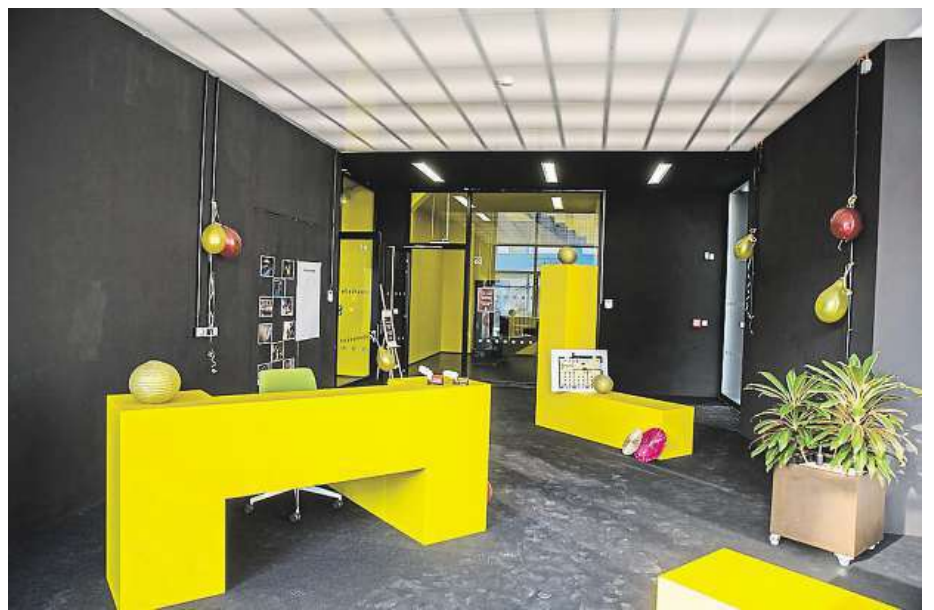
Hravé kanceláře můžete využívat i vy.