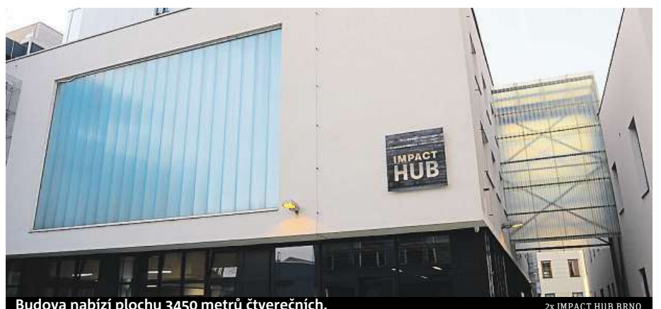
Budova nabízí plochu 3450 metrů čtverečních.