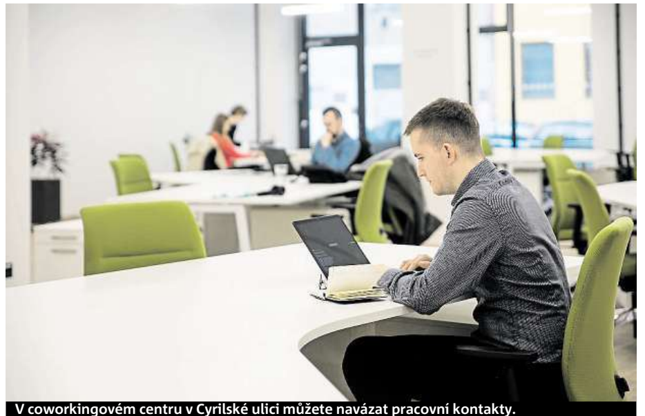
V coworkingovém centru v Cyrilské ulici můžete navázat pracovní kontakty.