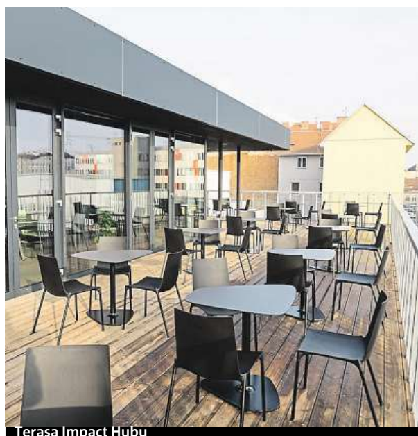
Terasa Impact Hubu