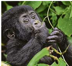
Mládě gorily horské M. G. C. Trade

Cílem projektu Go za Gorilou! je podpořit organizaci Gorilla Doctors pečující o poslední zbylé horské gorily žijící v ugandských horách a spo-