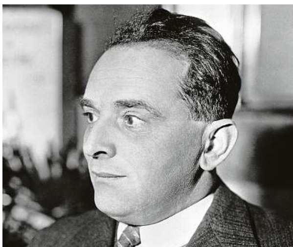
Spisovatel Karel Poláček se narodil v roce 1892.

Poláčekův otec, židovský obchodník s koloniálním zbožím, byl nejen předobrazem tatínka z Bylo nás pět , ale také milujícím rodičem, jenž kvitoval synovy úspěchy v Praze. Již v roce 1920 se tam Karel seznámil s bratry Čapkovými, načež se stal členem takzvaných pátečníků (mezi ně se vedle Karla a Josefa Čapků řadili i T. G. Masaryk či Edvard Beneš) a začal psát sloupky, soudničky a fejetony pro Lidové noviny – ty byly