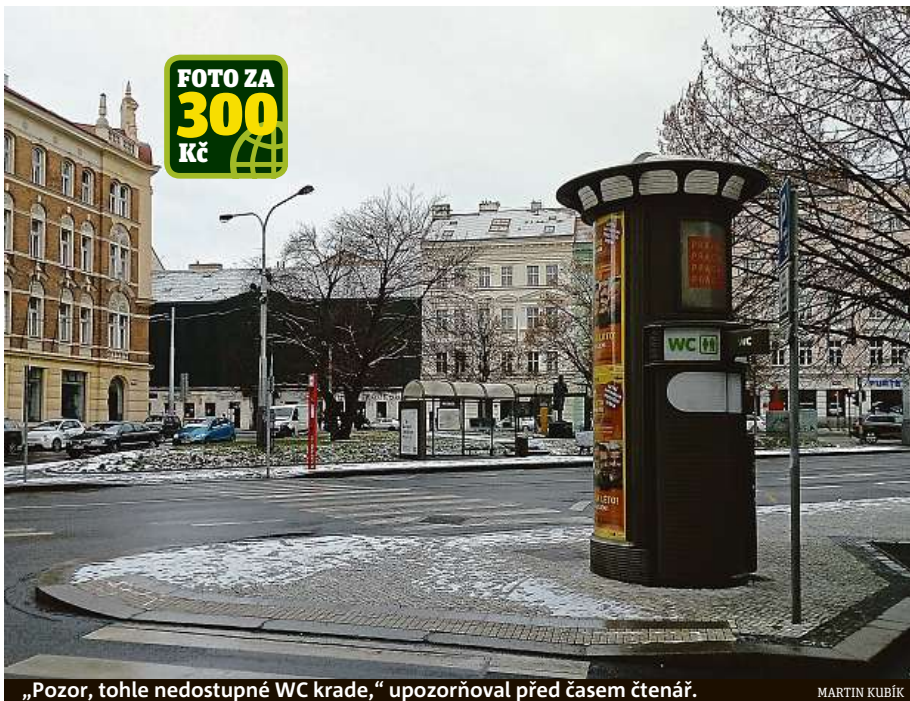
„Pozor, tohle nedostupné WC kradle,“ upozorňoval před časem čtenář.

Veřejných záchodků lze na území hlavního města nalézt pěknou řádku (návod najdete v boxu). Jen v páté městské části, kde se nachází i zmiňované porouchané WC, jich pod různými správci funguje něco přes deset. Nejvíce veřejných toalet se kromě centra