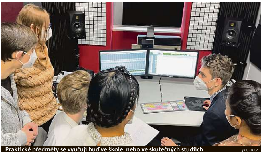
Praktické předměty se vyučují buď ve škole, nebo ve skutečných studiích.

Žáky podle něj nejvíce přitahuje již zmiňovaná tvorba zaměřená na YouTube. „Je to proto, že mezi zřizovateli jsou minoritní akcionáři Googlu a protože dnešní mladí lidé většinou jiná filmová média nesledují. Studenti se učí, jak natáčet, jak svou tvorbu propagovat a jak ji prezentovat. Dalším populárním stu-