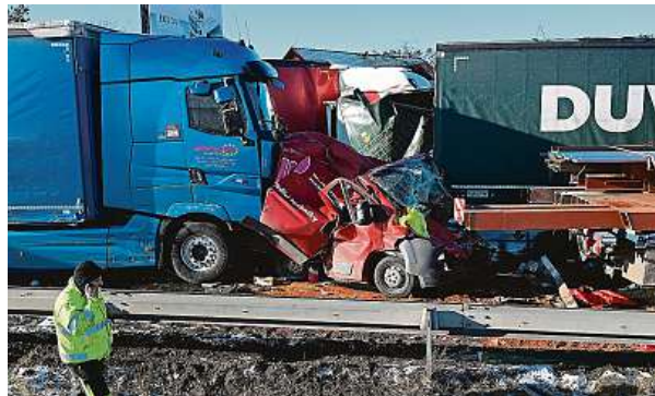
Nehoda u Žebráku. Srazilo se tam dvacet osobních aut a šestnáct kamionů. Při nehodě našťastí nikdo nezemřel.