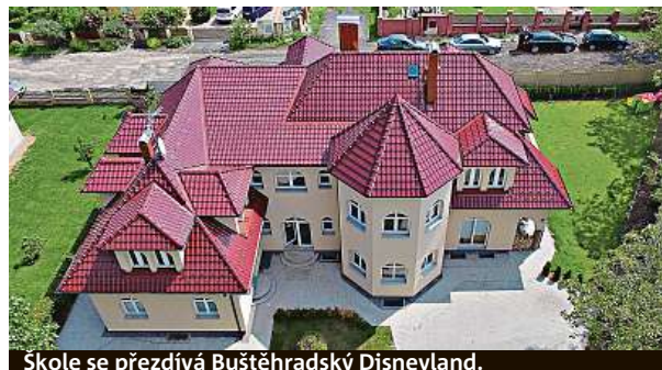
Škole se přezdívá Buštěhradský Disneyland.