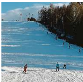
Ski areál Vaňkův kopec v Horní Lhotě u Ostravy

hybovat těsně nad nulou. Dnes bude proměnlivá, zpočátku zmenšená oblačnost. Ojedinele, na severovýchodě a jihozápadě, bude postupně místy sněžit. Večer bude v západní polovině Čech přibývat oblačnosti se sněžením. Nejvyšší teploty se budou pohybovat v rozmezí minus 2 až plus 2 stupně Celsia. Podobné počasí bude i přes víkend. Výraznější změnu počasí nepřinese ani první polovina příštího týdne. IDNES.cz a ČTK