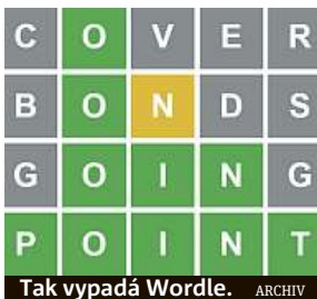
Tak vypadá Wordle.

Wordle. To je nový a velmi nakažlivý internetový hit.