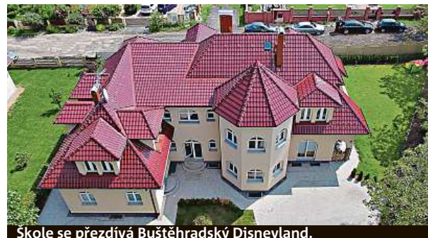
Škole se přezdívá Buštěhradský Disneyland.