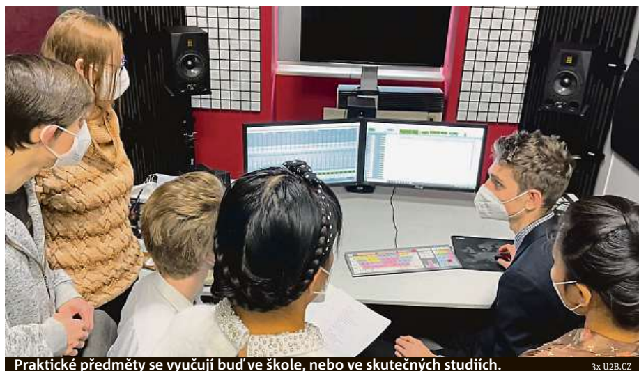
Praktické předměty se vyučují buď ve škole, nebo ve skutečných studiích.

Žáky podle něj nejvíce přitahuje již zmiňovaná tvorba zaměřená na YouTube. „Je to proto, že mezi zřizovateli jsou minoritní akcionáři Googlu a protože dnešní mladí lidé většinou jiná filmová média nesledují. Studenti se učí, jak natáčet, jak svou tvorbu propagovat a jak ji prezentovat. Dalším populárním stu-