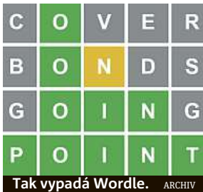
Tak vypadá Wordle.

Wordle. To je nový a velmi nakažlivý internetový hit.