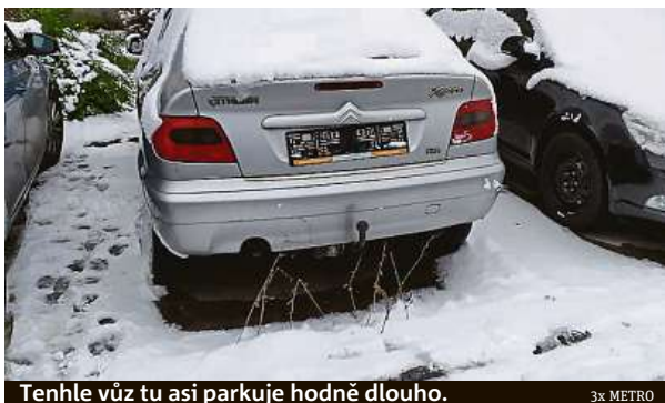
Tenhle vůz tu asi parkuje hodně dlouho.