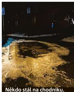
Někdo stál na chodníku.

Třetí vytipované místo je nejhorší. Nakonec parkujeme asi 200 metrů od „našeho“ vchodu. Stopky ukazují sedm minut a 29 vteřin. Leckdo namítne, že jiný den by situace mohla být jiná a čas by se lišil. Naším cílem ale nebylo najít nejhorší sídliště pro parkování. Čtěli jsme jen vyzkoušet každodenní strasti řidičů, kteří bydlí na sídlištích. Je to vážně děs. MAREK HÝŘ