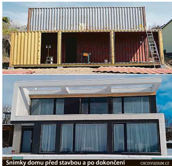
Snímky domu před stavbou a po dokončení

Dům má silné izolační vrstvy zvenku i zevnitř. Kontejner musel Popálený také náležitě ošetřit proti rzi. Boční stěny se prostě patnáctimetrový kamion nevytočí,“ doplňuje Popálený, jehož dům bude brzy on-line sdílet i přesné údaje o spotřebě tepla. PAVEL URBAN