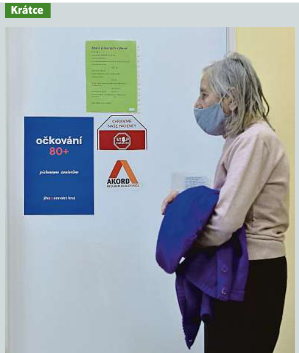
Jihomoravský kraj má další místo očkování seniorů.