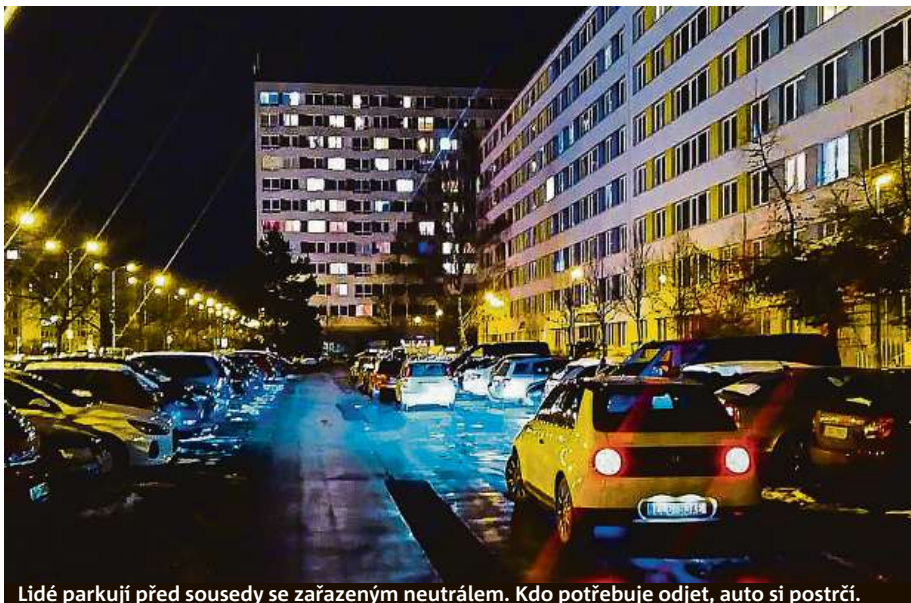
Lidé parkují před sousedy se zařazeným neutrálem. Kdo potřebuje odjet, auto si postrčí.

Nás se ale parkování na neutrál netýká. Stejně tak ani některých dalších moderních aut. Parkovací test absol-