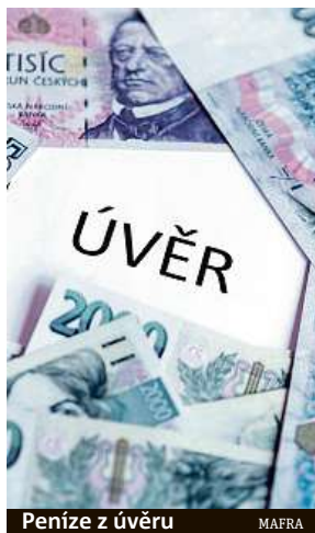
Peníze z úvěru MAERA

Možností je v Česku opravdu mnoho. Proto pro někoho, kdo si půjčku nikdy nebral, může být nabídka úvěrů tak trochu džunglí. Na internetu sice najdete řadu srovnávačů, které pro vás vyberou tu nejlepší možnost, přece jen je však potřeba mít alespoň základní znalosti ohledně toho, na co se zaměřit. Zaměřte se nejen na úrok a výši RPSN, ale také například na to, jak se k vám společnost bude chovat před půjčkou nebo třeba tehdy, když třeba přijdete o práci a budete mít problém splácet.