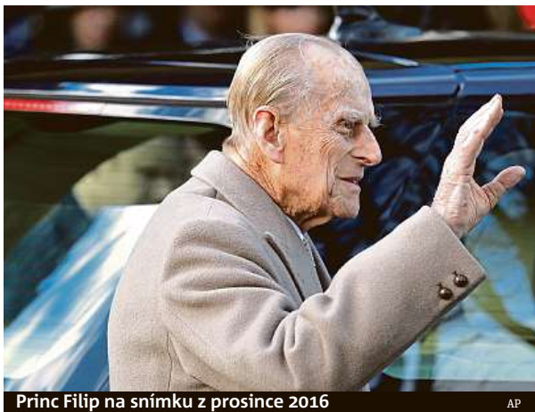
Princ Filip na snímku z prosince 2016

Policisté s vévodou z Edinburghu hovořili poté, co noviny zveřejnily snímky ze sobotního odpoledne, jak řídí bez zapnutého bezpečnostního pásu nový Land Rover Freelander na královském panství. Policiejní mluvčí v hrabství Norfolk