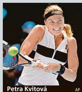
Petra Kvitová

Petra Kvitová si potěší v kariéře a poprvé po sedmi letech zahraje čtvrtfinále Australian Open. Osmá nasazená tenistka v osmifinále deklasovala sedmnáctiletou Američanku Anisi-