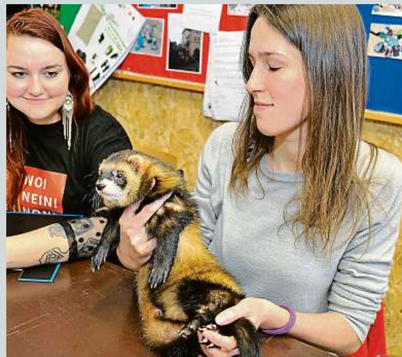
Hodnotila se kvalita srsti, stav zubů, proporce těla. ČTK

Dovoz ojetých aut starých do tří let se loni zvýšil o 29 procent, na 13 tisíc vozů. Stejným tempem rostl prodej i u největšího tuzemského obchodníka, Mototechny. Vyplývá to z informací SDA a Mototechny. „Na českém i slovenském trhu je stále více patrná změna chování zákazníků, kdy upřednostňují zánovní automobily namísto nových a rychlost nákupu. Právě u zánovních vozů mohou oproti novým ušetřit až 40 procent z ceny a nemusí čekat i půl roku, než se vyrobí,“ uvedla generální ředitelka skupiny AAA Auto a Mototechna Karolína Topolová. Nejvíce dovoženými značkami jsou Škoda, Volkswagen a Mercedes-Benz. ČTK