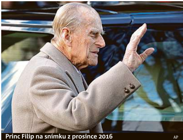
Princ Filip na snímku z prosince 2016

Policisté s vévodou z Edinburghu hovořili poté, co noviny zveřejnily snímky ze sobotního odpoledne, jak řídí bez zapnutého bezpečnostního pásu nový Land Rover Freelander na královském panství. Policieji mluvčí v hrabství Norfolk