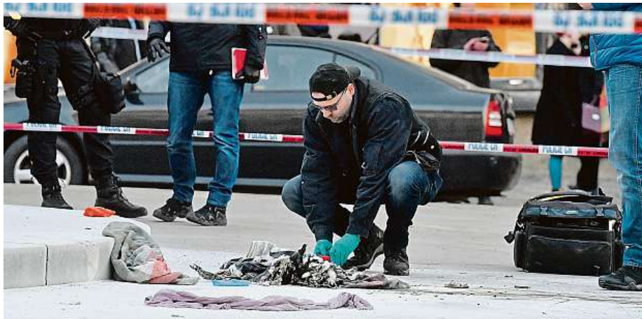
Situace po pátečním pokusu o sebevraždu. Muž má popáleniny na 30 procentech těla.

Muž, který se chtěl v pátek upálit, je v ohrožení života. Policie vyšetřuje také případ, kdy se další člověk chtěl upálit.