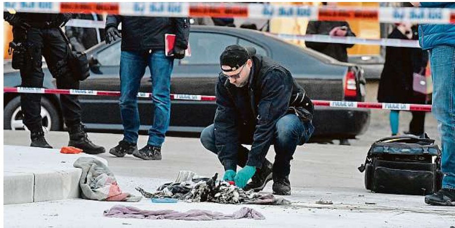
Situace po pátečním pokusu o sebevraždu. Muž má popáleniny na 30 procentech těla.

Muž, který se chtěl v pátek upálit, je v ohrožení života. Policie vyšetřuje také případ, kdy se další člověk chtěl upálit.