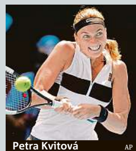
Petra Kvitová

Petra Kvitová si potěší v kariéře a poprvé po sedmi letech zahraje čtvrtfinále Australian Open. Osmá nasazená tenistka v osmifinále deklasovala sedmnáctiletou Američanku Anisi-