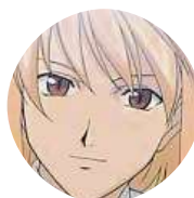
Eliška Tsunade Valkýra Na Berounce, když zamrzne, což si skoro nepamatuji.