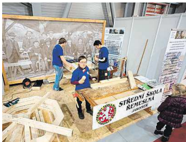
Studenti ukazují, co se ve školách učí.

Veletrh bude cílit jak na koncové zákazníky, pro které bude vytvořen jasný systém porovnávání a garantování kvality, tak na odbornou veřejnost. Mělo by se dosáhnout zásadního posílení profesních spolků a odborných škol. Důležité je také začít na státní správu, kde dojde jak k zahájení legislativních změn v živnostenském podnikání, tak k cílené podpoře vzdělávání. Důležité bude také se zaměřit na zvýšení motivace pro budoucí studenty při rozhodování o studiu na odborných a středních technických školách. METRO