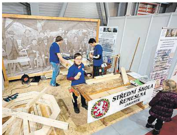
Studenti ukazují, co se ve školách učí.

Veletrh bude cílit jak na koncové zákazníky, pro které bude vytvořen jasný systém porovnávání a garantování kvality, tak na odbornou veřejnost. Mělo by se dosáhnout zásadního posílení profesních spolků a odborných škol. Důležité je také začít na státní správu, kde dojde jak k zahájení legislativních změn v živnostenském podnikání, tak k cílené podpoře vzdělávání. Důležité bude také se zaměřit na zvýšení motivace pro budoucí studenty při rozhodování o studiu na odborných a středních technických školách. METRO