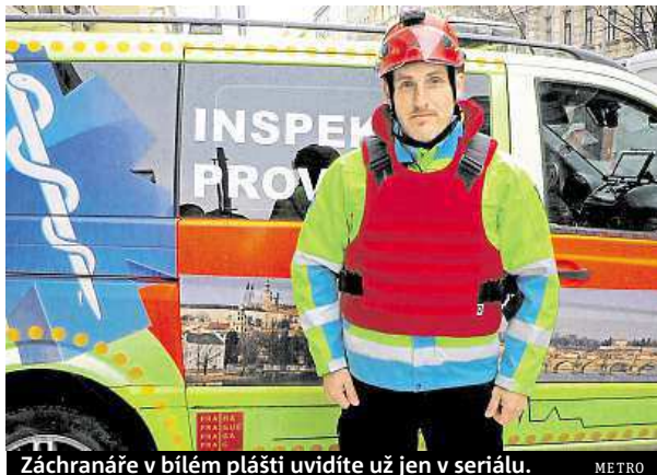
Záchranáře v bílé plášti uvidíte už jen v seriálu. METRO

Balistické vesty, helmy s ochranným štítem a čelov-