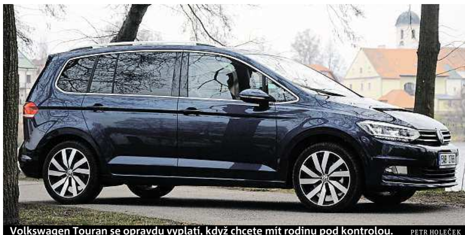
Volkswagen Touran se opravdu vyplatí, když chcete mít rodinu pod kontrolou. PETR HOLEČEK

Nejzásadnější kritérium – při výběru rodinného auta důležitější než barva, mnohdy i než motor. Prostoru je dost pro posádku i bagáž. Pokud nechcete kupovat velké a drahé MPV typu Galaxy, je touran dobrá volba. Mezi MPV středních rozměrů má více místa v kufru snad jen Renault Grand Scenic. Nový touran má prodloužený rozvor, takže u pětimístné verze nabízí v zavazadelníku objem 743 litrů. A to je o 62 kilo lehčí než předchůdce.