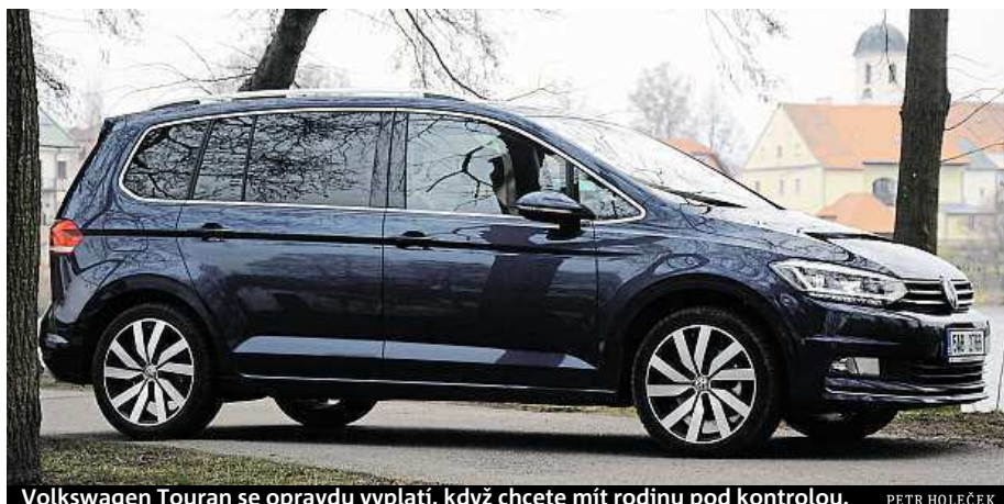
Volkswagen Touran se opravdu vyplatí, když chcete mít rodinu pod kontrolou. PETR HOLEČEK

Nejzásadnější kritérium – při výběru rodinného auta důležitější než barva, mnohdy i než motor. Prostoru je dost pro posádku i bagáž. Pokud nechcete kupovat velké a drahé MPV typu Galaxy, je touran dobrá volba. Mezi MPV středních rozměrů má více místa v kufru snad jen Renault Grand Scenic. Nový touran má prodloužený rozvor, takže u pětimístné verze nabízí v zavazadelníku objem 743 litrů. A to je o 62 kilo lehčí než předchůdce.