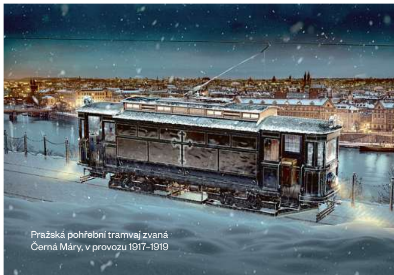
Pražská pohřební tramvaj zvaná Černá Máry, v provozu 1917–1919

Přejeme Vám, ať se v roce 2024 obejdete bez našich služeb.