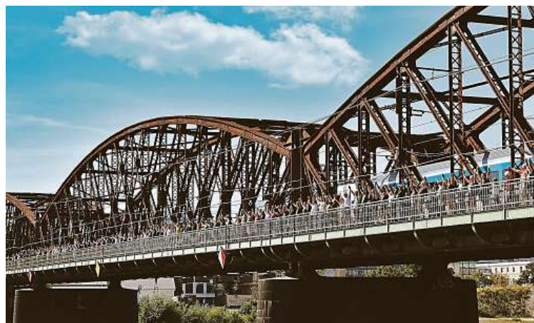
Sešli se na mostě. Jedna z akcí proti likvidaci kulturní památky.

Ministrovo vyjádření ostře odsoudila iniciativa Nebourat, která proti záměru uspořádala mimo jiné on-line petici. Podle spolku není možné kvůli „tuposti jednoho politického rozhodnutí“ nevratně poškodit historické centrum Prahy.