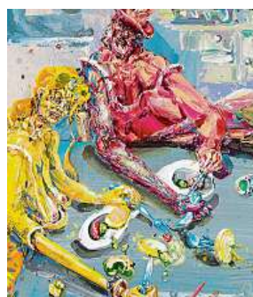
Umělec a jeho dílo Nohy na stole

Své malířské i kreslířské dílo rozvíjel od poloviny 70. let. V druhé polovině 90. let překvapil veřejnost proměnou expresivního figuralisty v krajináře. Poslední léta pracuje především ve svém venkovském ateliéru v Brniřově na Domažlicku, což výrazně ovlivňuje námětový rejstřík jeho maleb. MET