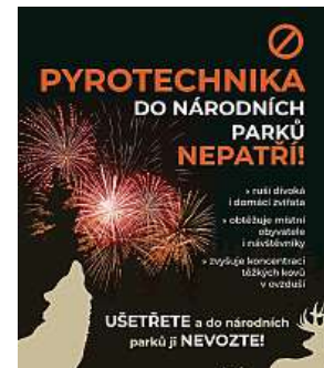
Myslete na přírodu.

Zákaz používání zábavní pyrotechniky také v roce 2020 zavedla česká metropole (více v boxu).