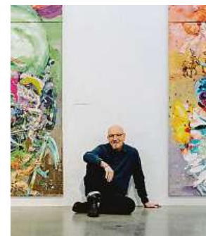
2x MUSEUM KAMPA