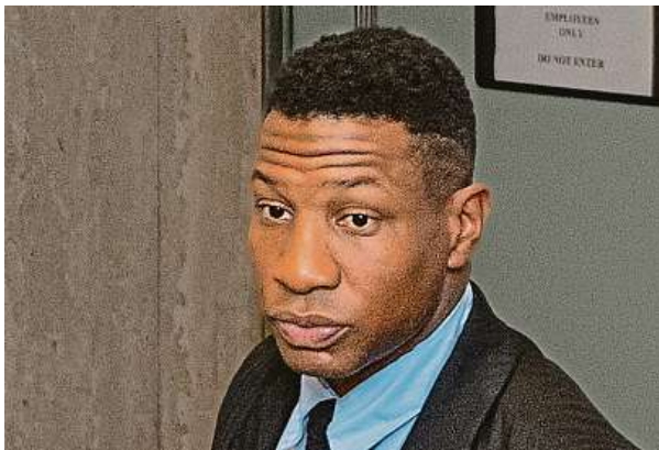
Nepříjemný incident může Jonathanu Majorsovi zhatit slibnou hollywoodskou kariéru.

Studio Marvel v prohlášení uvedlo, že s ním ve svých následujících projektech nepočítá. Herec přitom měl být hlavní postavou několika filmů, například Avengers: The Kang Dynasty. Jeho premiéru společnost již v reakci na Majorsovo dřívější zadržení odložila na rok 2026. ČTK