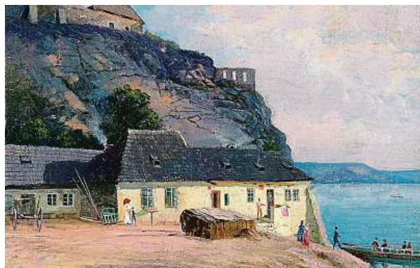
Na malbě Jana Minaříka je vyšehradský přívoz. Mimochodem, další povídání o pražských tajemstvích najdete v knihách Davida Černého.

Na vyšehradské skále žije vojvoda všech vodníků v českém království. Ve své době se říkávalo, že vodník a převozník jsou tatáž osoba. A mnohým přišlo, že to není zrovna nejlepší souběh řemesel, neboť převozník lidí po vodě převáží, a vodník je naopak topí, což může způsobit v duši vodníka-řevozníka rozpor, jak má se svěřenými lidmi vlastně naložit. Vyšehradský hashrman se zaměřuje především na švarné mládence, kteří zamilovaní ztratí hlavu a stanou se jeho snadnou kořistí. Slabou útěchou je, že životy utopenců nejsou zcela zmařeny, protože se snad stanou rekruty bájného vojska kněžny Libuše, sídlícího ve vyšehradské skále, což je jakási druhá setnina blanických rytířů. Pokud má vyšehradský vodník pocit, že dlou-