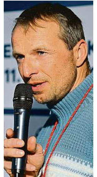
Stanislav Řezáč, živoucí legenda Jizerské padesátky