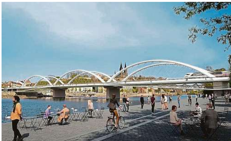
Vítězný návrh nového železničního mostu pod Vyšehradem