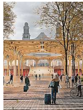
Promění se i park.

„V rámci participace bude od 10. ledna na stránkách projektu přístupný dotazník, ve kterém bude možné definovat požadavky na fungování prostoru území hlavního nádraží, tedy Vrchlického sadů, tramvajové trati i odbavovací haly. Od 10. do 21. ledna vyrostete v hale nádraží i stánek, kde bude možné o projektu zjistit více,“ připomíná mluvčí. MAH