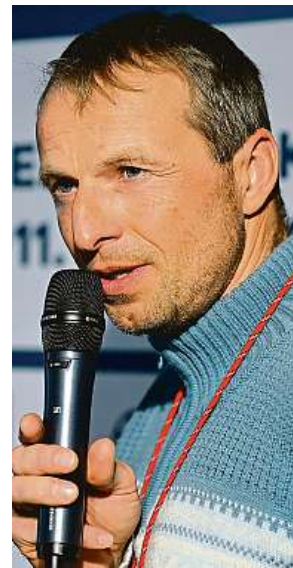
Stanislav Řezáč, živoucí legenda Jizerské padesátky