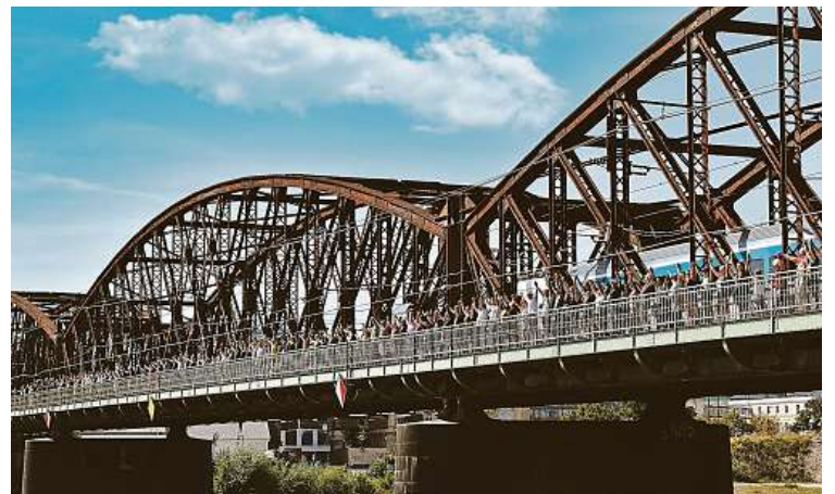
Sešli se na mostě. Jedna z akcí proti likvidaci kulturní památky.

Ministrovo vyjádření ostře odsoudila iniciativa Nebourat, která proti záměru uspořádala mimo jiné on-line petici. Podle spolku není možné kvůli „tuposti jednoho politického rozhodnutí“ nevratně poškodit historické centrum Prahy.