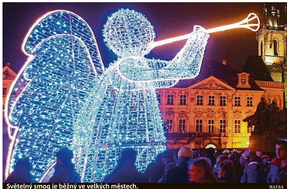
Světelný smog je běžný ve velkých městech.