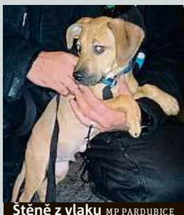
Štěně z vlaku MP PARDUBICE

Neobvyklého cestujícího měl v úterý večer osobní vlak z Prahy do Pardubic. V Pečkách na Kolínsku do něj přistoupilo malé štěně bez lidského doprovodu. Průvodčí zvíře v Pardubicích předal strážníkům, kteří ho na noc umístili do útulku.