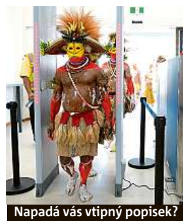
Napadá vás vtipný popisěk?

Napište bublinu a reagujte na sloupek na: www.facebook.com/denikmetro