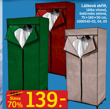
Látková skříň, látka vinová, šedá nebo zelená, 75 × 160 × 50 cm, 1006540-03, 04, 05