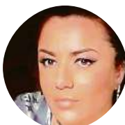
Nela Udělám vánočku a zbytek koupím.