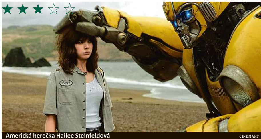
Americká herečka Hailee Steinfeldová

Oproti prvnímu dílu Transformers je film Bumblebee o dost komornější kousek. Fanoušci megašarvátek si sice také přijdou na své, ale prim v tomhle snímku hraje spíš