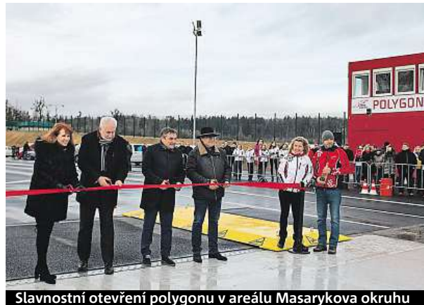
Slavnostní otevření polygonu v areálu Masarykova okruhu

skou autosedačkou, a seznámí se s legislativou. Na jaře se do portfolia služeb přidá žádaný kurz sloužící pro odpočet trestných bodů nasbíraných za dopravní přestupky. Tréninkové centrum svými parametry splňuje podmínky pro školení nákladních vozů, čehož mohou využít napří-