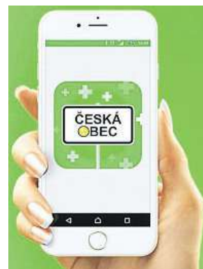
Náhled aplikace ČESKÁ OBEC

Největší sledovanosti dosahuje aplikace v městské části Brno-sever, nicméně ostatní nikterak nezaostávají. Celková sledovanost se v jednotlivých městských částech pohybuje v řádech tisíců. Brněnský projekt slaví úspěch nejen doma. Po dvou letech od jeho vzniku jej používají stovky dalších obcí po celé republice. BAB