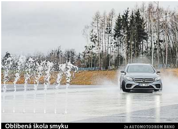
Oblíbená škola smyku