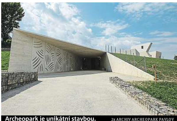
Archeopark je unikátní stavbou.