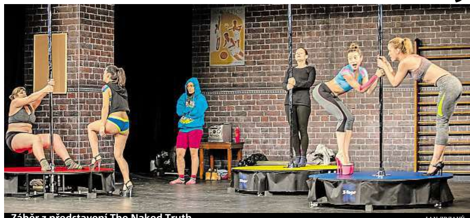
Záběr z představení The Naked Truth