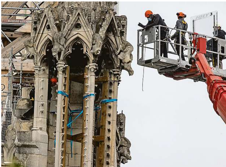
Práce na katedrále pokračují. Dělníci nyní odstraňují poškozené lešení.

Po příčinách požáru se stále pátrá. Nejpravděpodobnější příčinou se jeví elektrický zkrat nebo špatně uhašený cigaretový nedopalek. Podle vyšetřovatelů významný chrám nikdo nezapálil úmyslně. ČTK a MET