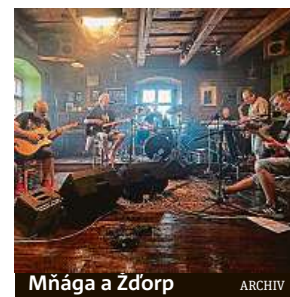
Mňága a Žďorp