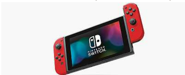
Věru zajímavá nabídka!

Černým pátkem si společnosti a prodejci s trochou nadšázky připomínají nechvalně známý krach newyorské burzy roku 1929. Z této noční mýry zrozený svátek spotřebitelů je známý po celém světě, a tak se mu nevyhnou ani zákazníci v České republice. Abychom vám usnadnili orientaci v přešlých svítících