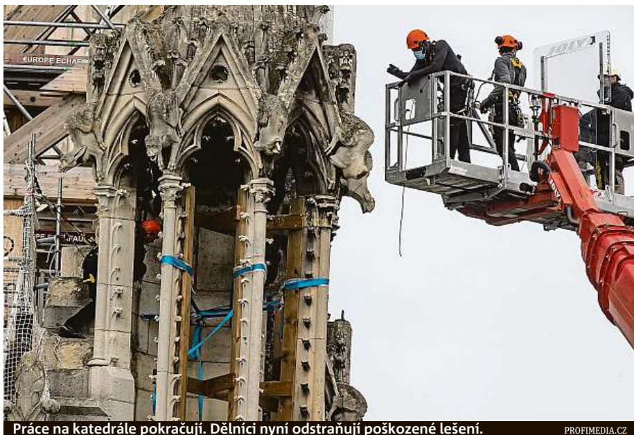
Práce na katedrále pokračují. Dělníci nyní odstraňují poškozené lešení.

Požár zřejmě způsobil elektrický zkrat nebo špatně uhašený cigaretový nedopalek. Podle vyšetřovatelů významný chrám nikdo nezapálil úmyslně. ČTK a MET