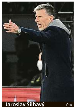
Jaroslav Šilhavý ČTK

Kvůli dlouhé koronavirové pauze se letos hrály reprezentační zápasy jen na podzim. Český tým postihly problémy s covidem-19 při všech třech