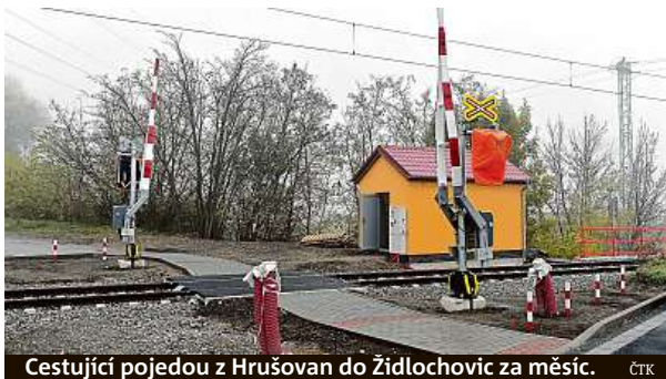
Cestující pojedou z Hrušovan do Židlochovic za měsíc.

Tříkilometrová železniční trať z Hrušovan u Brna do Židlochovic prošla technicko-bezpečnostní zkouškou.