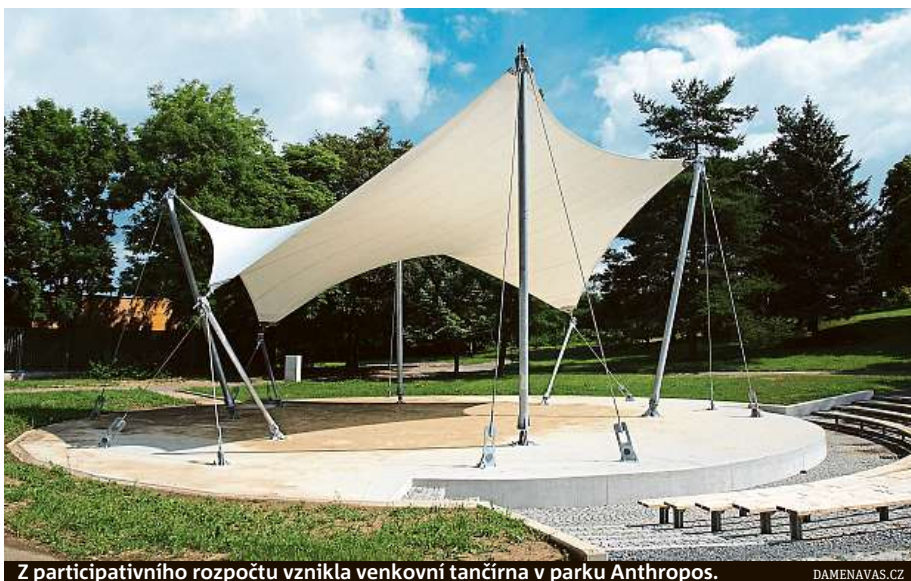
Z participativního rozpočtu vznikla venkovní tanečrna v parku Anthropos. DAMENAVAS.CZ

Mezi nimi se letos často objevují revitalizace zeleně, budování hřišť nebo cyklostezek. Figurují tam ale například i houpačka a kolotoč pro vozíčkáře nebo programy pro onkologicky nemocné děti. Právě ty v době uzávěrky tohoto vydání v hlasování vedly. „Komplexní podpora péče o onkologicky nemocné dítě by měla obsahovat různé terapie, výživové poradenství, vzdělávací programy, zajištění volnočasových aktivit,