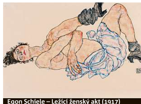
Egon Schiele – Ležící ženský akt (1917)

MODERNÍ EKOLOGICKÁ LISOVNA PLASTŮ Cegan s.r.o. | pracoviště: Husova 1693/35 CZ-664 51 Šlapanice | tel.: 775 884 413 kariera@cegan.cz | www.cegan.cz