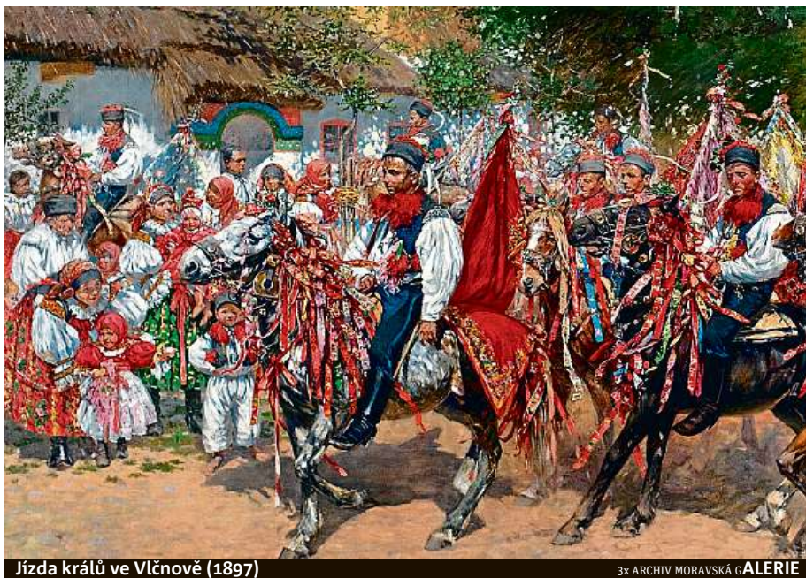
Jízda králů ve Vlčnově (1897)

Moravská galerie připravuje novou expozici v Místodržitelském paláci. V polovině listopadu otevřela její první část. Ta nese název Brno, předměstí Vídně a věnuje se umění 19. století. Návštěvníci se zde dozvědí, jak silné byly umělecké vazby mezi habsburskou metropolí a moravským kulturním centrem. Společně se tu prezentují Joža Uprka s Hansem Makartem, Egon Schiele vedle Josefa Hoffmanna nebo Gustav Klimt u Alfonse Muchy. Důležitým znakem