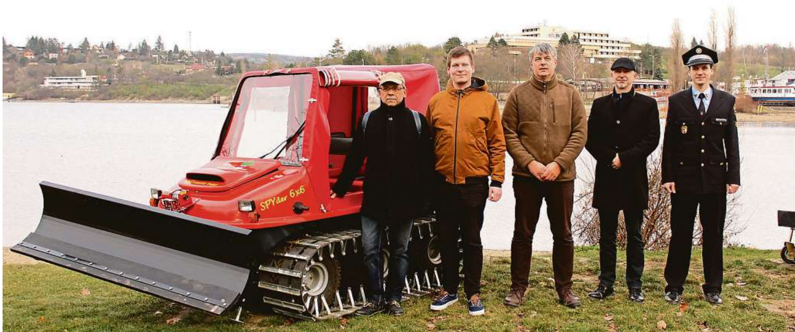
Díky participativnímu rozpočtu byla například pořízena rolba pro úpravu ledu na Brněnské přehradě. DAMENAVAS.CZ