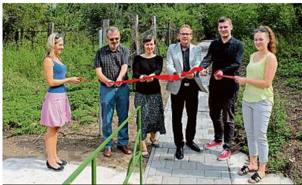
Již dříve vznikla vycházková trasa v Tuřanech. DAMENAVAS.CZ