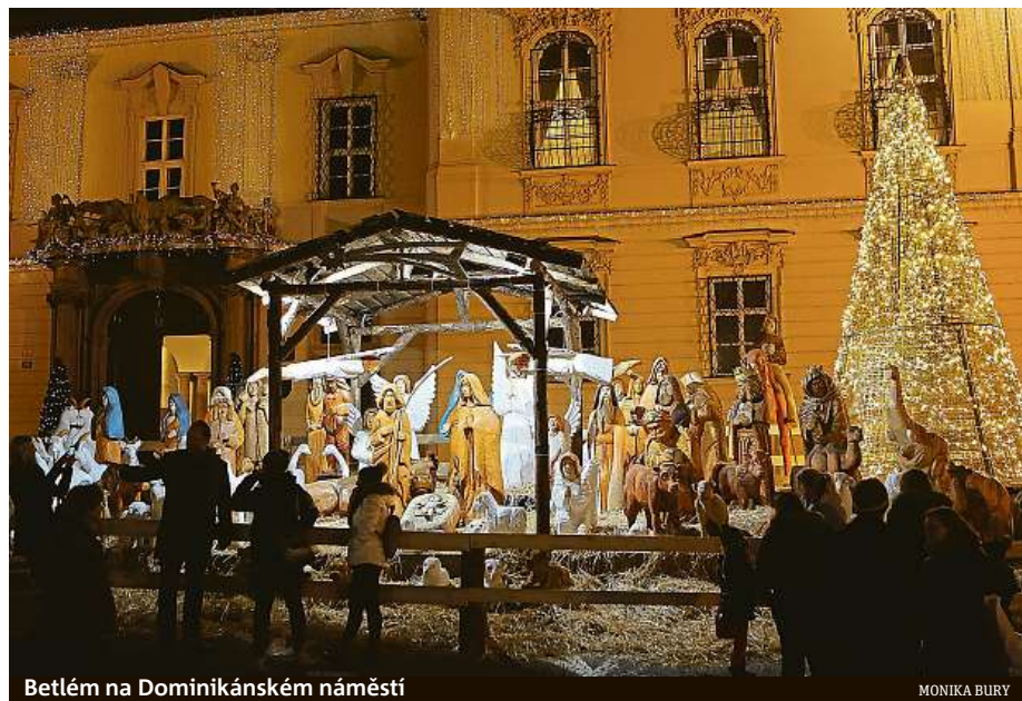
Betlém na Dominikánském náměstí