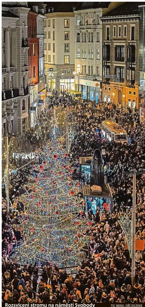
Rozsvícení stromu na náměstí Svobody

Zelný trh patří během adventu už pravidelně řemeslům a tradicím. I letos se zde otevře 120 prodejních míst s nabídkou řemeslných výrobků, dárkového zboží, adventních dobrot a nápojů na zahřátí. Program dá prostor divadelním souborům i mladým kapelám, například brněnskému vokálnímu uskupení Shot-C. RADEK BABIČKA