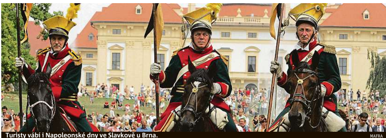
Turisty vábí i Napoleonské dny ve Slavkově u Brna.

Celkově počet turistů v Česku ve třetím kvartále rostl o 2,6 procenta a tempo růstu