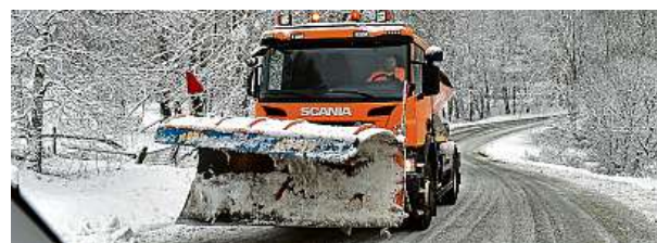
Zimní sezona je za dveřmi.