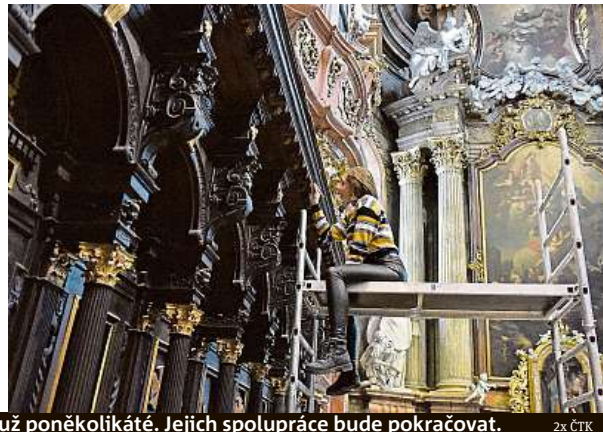
Brněnští a mnichovští studenti restaurátorství pracují společně už poněkolikáté. Jejich spolupráce bude pokračovat.

ším prvkem vybavení interiéru jezuitského kostela a jedním z nejstarších v Brně. „Kostel Nanebevzetí Panny Marie byl původně součástí jezuitského kláštera a jezuitské brněnské koleje. Nyní stojí samostatně, a proto se již k původnímu účelu nepoužívají, dnes je to však velice cen-