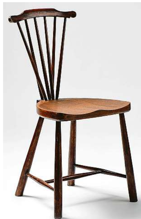
Adolf Loos (1904)