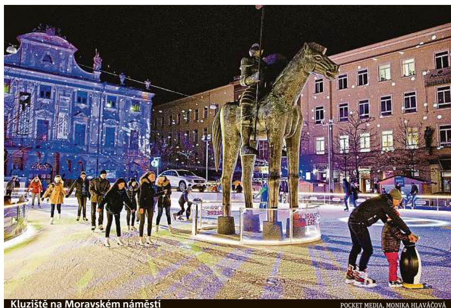
Kluziště na Moravském náměstí