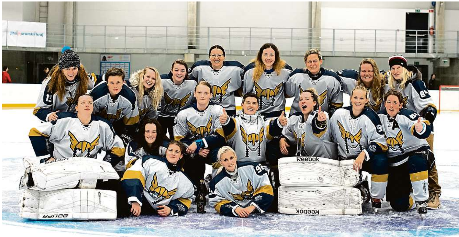
Hokejový tým WHC Valkyries Brno na kuřimském ledě