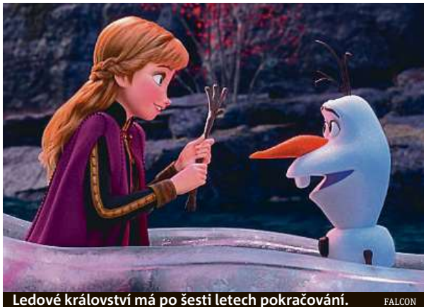
Ledové království má po šesti letech pokračování.

Animovaný film Ledové království II jde do kin zítra.