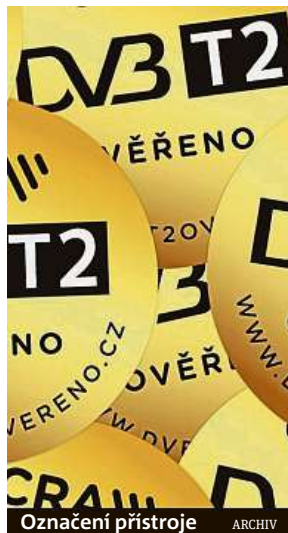
Označení přístroje ARCHIV

„Pokud máte doma náš internet a využíváte připojení od 50 megabitů za sekundu a víc, nemusíte víc řešit,“ říká Jitka Pajurková z O2. V rámci nových tarifů nabízí operátor základní variantu, kde jsou