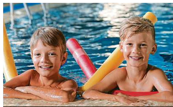
Sportování s kamarády je motivující.