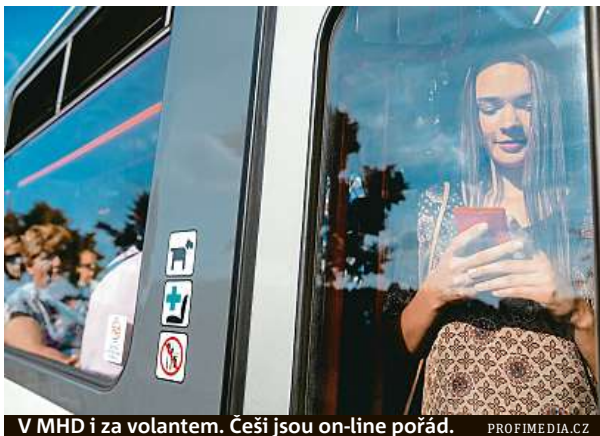
V MHD i za volantem. Češi jsou on-line pořád.

Nejprve jsme vyrazili do metra. Vyjeli jsme z I. P. Pavlova a vystoupili na Kačerově. V ranní špičce jsme stihli projít pět vagonů. V každém bylo zhruba pět lidí, kteří byli připojeni na internet. A to jsou v úseku metra mezi stanice-