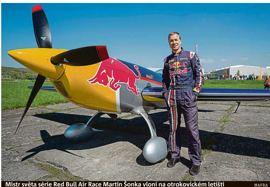
Mistr světa série Red Bull Air Race Martin Šonka vloni na otrokovickém letišti

Ve čtvrtfinále se Šonka utkal se svým největším rivalem a vedoucím mužem seriálu Michaellem Goulianem a také díky Američanovým chybám přes něj postoupil do final four. V něm ho mohl o ti-