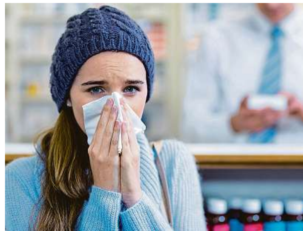
Astmatikům chlad nesvědčí.

Pro astmatiky jsou problematická jak letní vedra, tak i silně chladné zimní dny. Nízké teploty, respektive suchý ledový vzduch venku, stejně jako přechody z tepla do zimy totiž znamenají jednoznačně velkou zátěž pro dýchací cesty. Pacienti s alergickým astmatem mají zhoršení dechových problémů vázané