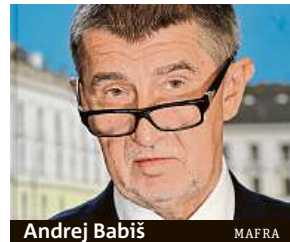
Andrej Babiš MAFRA

Zeman ale už dříve uvedl, že toto ustanovení neznamená, že by dolní komoru rozpustit musel. Podle jeho vyjád-