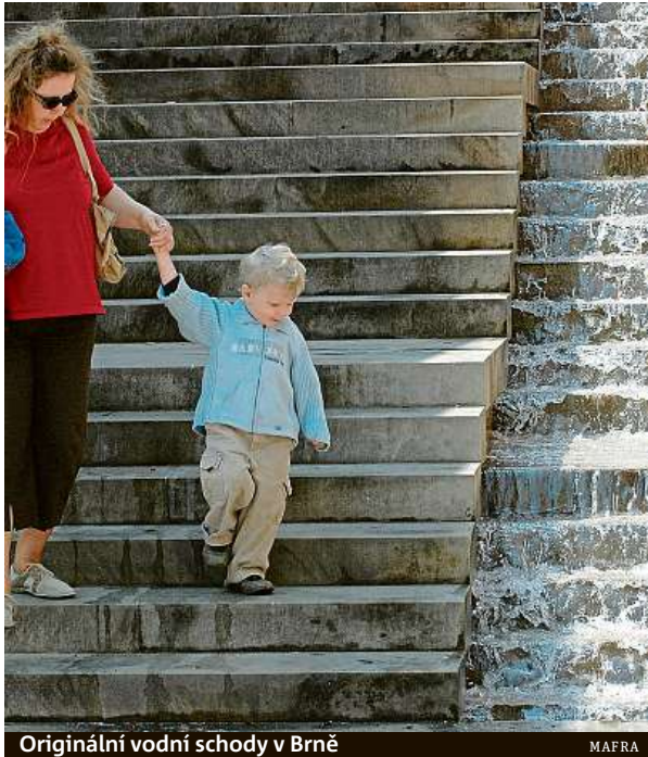
Originální vodní schody v Brně

Z grantového programu mohou již počtvrté obce, školy nebo další instituce financovat například nákup sazenic, materiálů, dále odborné poradenství nebo přípravu