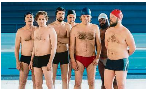
Fotografie z filmu Utop se, nebo plav

Francouzský režisér Gilles Lellouche na festivalu v Cannes letos potěšil a dojal diváky komedií o bláznivém snu,