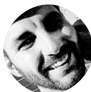
Rumcajs Slavici Mír Vždy, když zapípá.