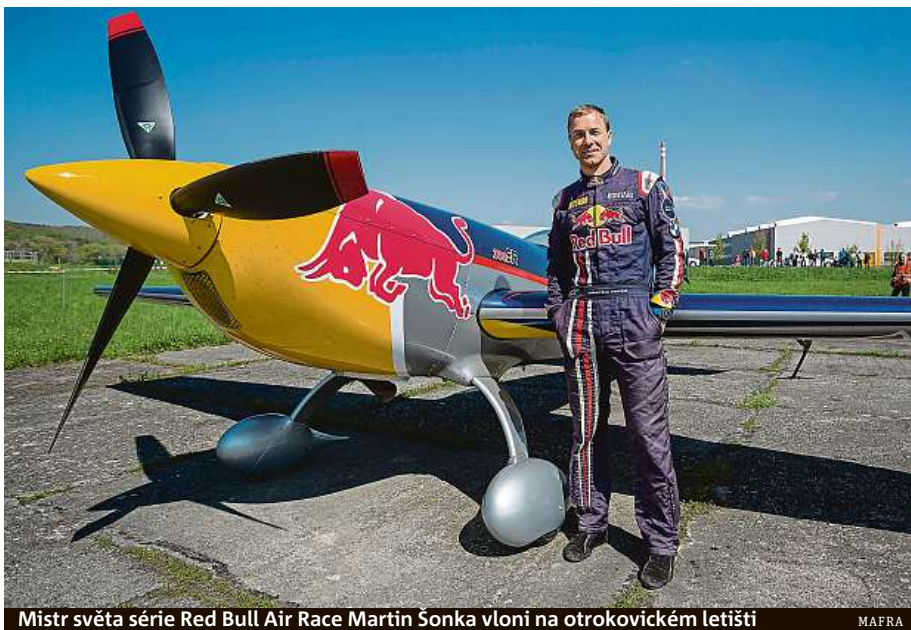
Mistr světa série Red Bull Air Race Martin Šonka vloni na otrokovickém letišti

Ve čtvrtfinále se Šonka utkal se svým největším rivalem a vedoucím mužem seriálu Michaellem Goulianem a také díky Američanovým chybám přes něj postoupil do final four. V něm ho mohl o ti-