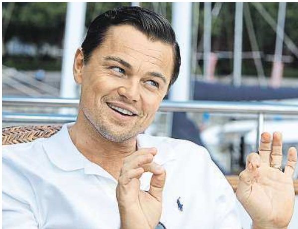
Leonardo DiCaprio jako obchodník na Wall Street

I celý víkend bude Prima Max zásobovat fanoušky filmů, a to jak ty dětské s Hledá se Nemo či Kung Fu Panda, tak i dospělé s Žhavými výstřely, Mission Impossible či Psem baskervillským.