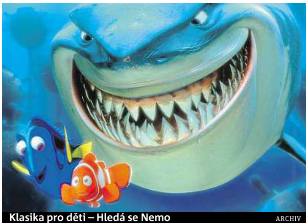
Klasika pro děti – Hledá se Nemo ARCHIV