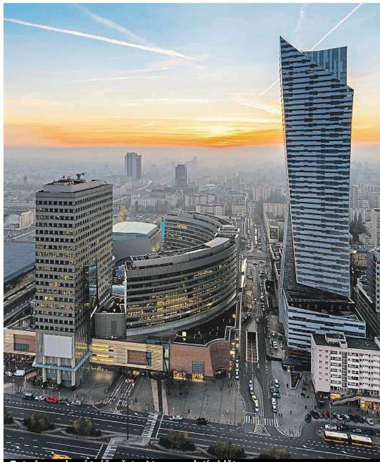
Toto je moderní tvář města. I tu se vyplatí vidět.