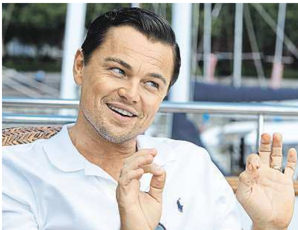
Leonardo DiCaprio jako obchodník na Wall Street

I celý víkend bude Prima Max zásobovat fanoušky filmů, a to jak ty dětské s Hledá se Nemo či Kung Fu Panda, tak i dospělé s Žhavými výstřely, Mission Impossible či Psem baskervillským. METRO