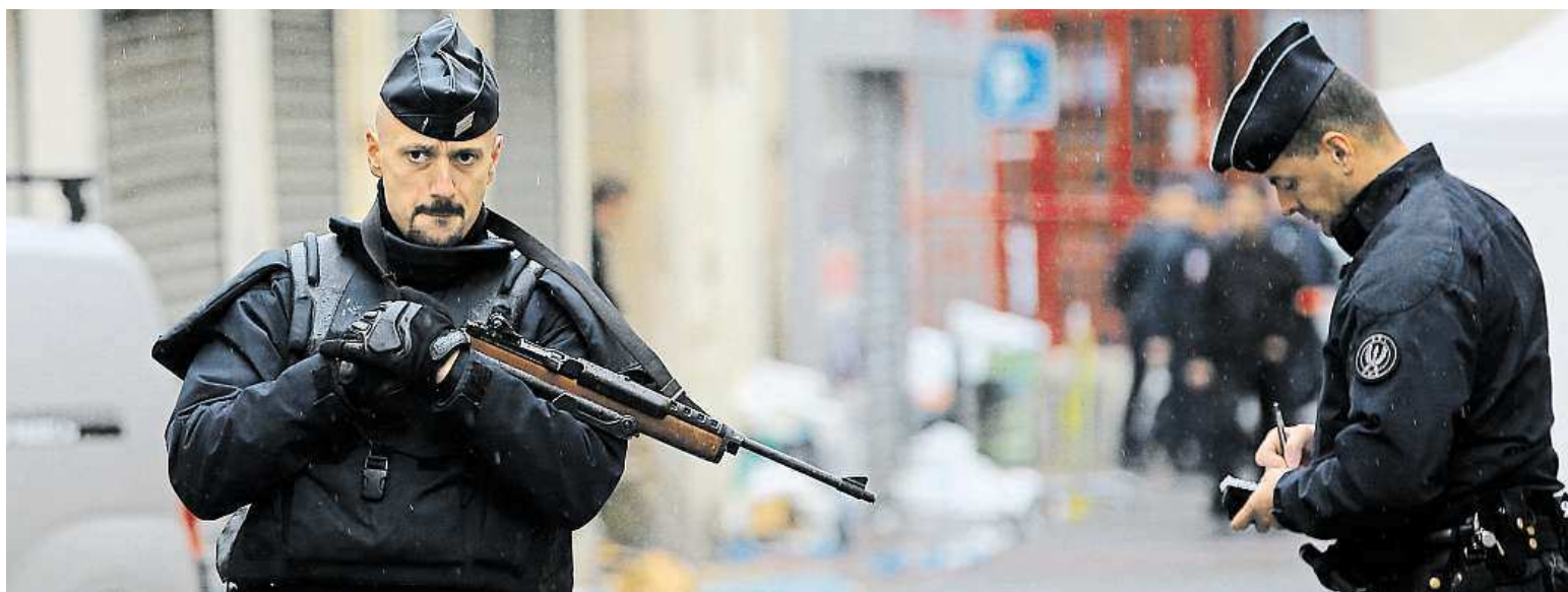
Policisté včera hlídali oblast na pařížském předměstí Saint-Denis, kde o den dříve proběhl velký záťah na strůjce pátečních teroristických útoků.

Nebezpečí trvá. Výjimečný stav byl ve Francii prodloužen o tři měsíce. Hrozba. Premiér Valls varoval, že teroristé mají chemické i biologické zbraně. Potvrzeno. Strůjce pátečních útoků byl ve středu zabit STRANA 8