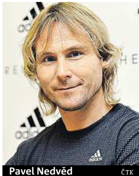
Pavel Nedvěd

Bylo by lepší, kdyby dostali těžkou skupinu, protože by mohli překvapit a hrálo by se jim líp. Kluci na to mají. Třeba Itálie je zajímavý soupeř a na ten zápas bych se těšil.