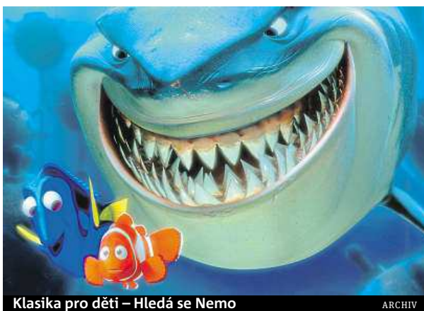
Klasika pro děti – Hledá se Nemo