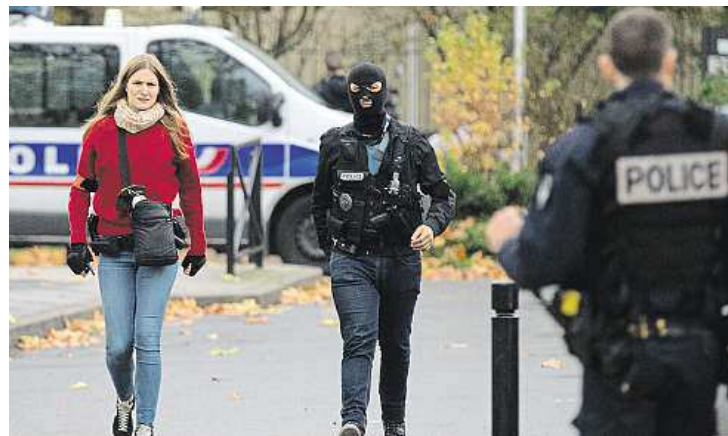
Policiisté budou mít pohotovost dál. Výjimečný stav platí tři měsíce.

Nebezpečí útoků hrozí dál. Prezident Hollande chce zemi maximálně chránit.