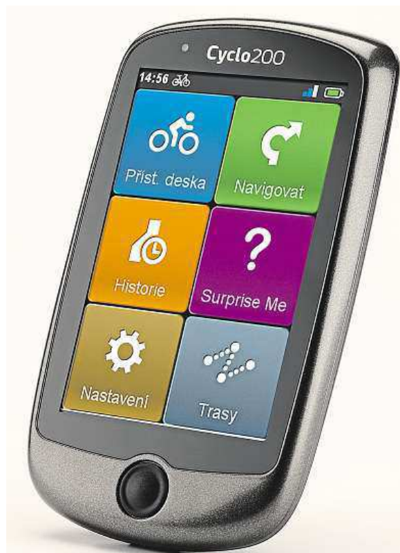
MIO Cyclo 200 zaujme kompaktním provedením.

Mio Cyclo™ 200 zaujme kompaktním a voděodolným provedením s dominantním dotykovým displejem o velikosti 3,5 palce. Díky antireflexní vrstvě, jež zabraňuje nepříjemným odleskům, jsou údaje na displeji perfektně čitelné i na přímém sluníčku. V menu se zorientujete snadno, jeho struktura je přehledná a ovládání naprosto intuitivní. Kromě klasického navigování z bodu A do bodu B, nabízí Mio 200 i zajímavou funkci „Překvap mě“, která pro vás vyhledá neobvyklé trasy, a vy tak pokaždé zažijete