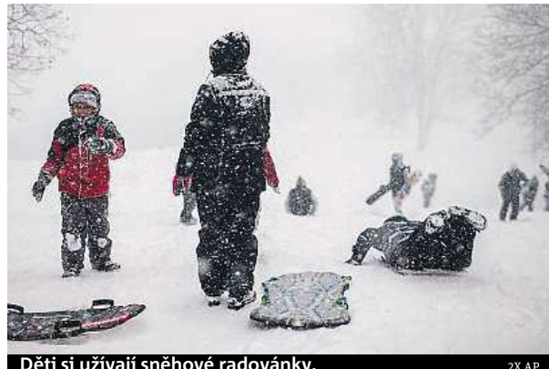
Děti si užívají sněhové radovánky.