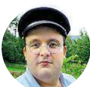
Jeník Fořt Až kapřiči připloujou do správného rybníka.