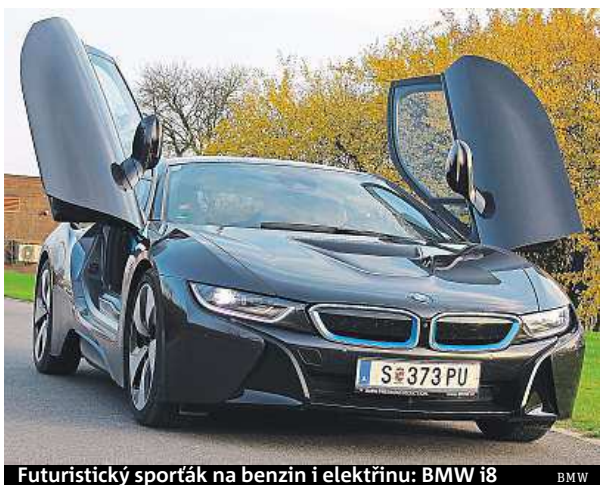
Futuristický sporták na benzin i elektřinu: BMW i8

Na delší trasy nebo kdykoli na vyžádání tlačítkem či plynovým pedálem se zapojuje