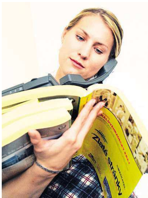
Žluté stránky jsou minulostí.

Bezplatný katalog Zlaté stránky začal vycházet v roce 1992 ve dvou vydáních pro Prahu a jižní Moravu. Kromě základního seznamu občanských stanic nabídl nový katalog tištěný na žlutém papíře i přehled čísel firem. Za peníze navíc umožňoval například viditelnější zařazení nebo také i celostránkovou inzerci.