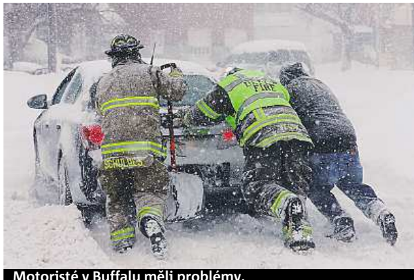
Motoristé v Buffalu měli problémy.