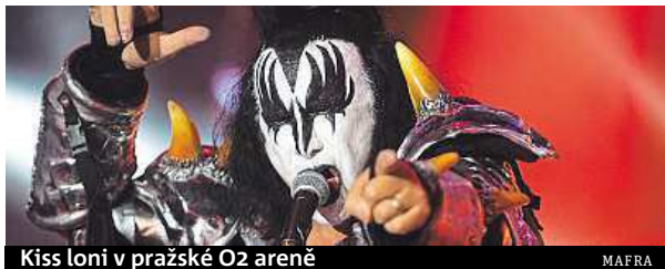
Kiss loni v pražské O2 areně

Americká rocková legenda Kiss vystoupí 8. června příštího roku v rámci turné u příležitosti svého 40. výročí v pražské O2 areně. Na koncertu představí zásadní hity své kariéry zabalené do bombastické pyrotechnické show. Předprodej vstupenek v cenách 1350 až 1990 Kč začne 24. 11. ČTK