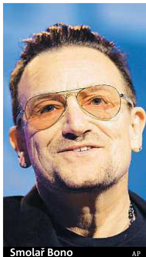
Smolař Bono AP

Bez škrábnutí už nevyvázl ovšem při nedělním pádu z kola v newyorském Central Parku. Při něm utrpěl nejméně šest zlomenin a na operacím sále strávil pět hodin. Uvedla to včera americká média. První zprávy o nehodě čtyřiapadesátiletého frontma-