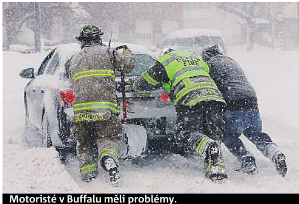
Motoristé v Buffalu měli problémy.