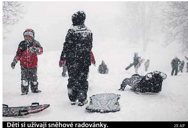
Děti si užívají sněhové radovánky.