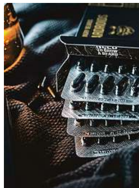
U Beardroidů si připlatíte. Balení vyjde na 649 korun. ANGRY BEARDS

Magické tobolky nabízí také konkurenční tuzemská, re-