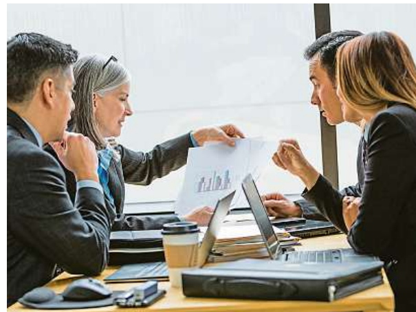
Každoroční „papír do Bruselu“ bude ve firmě muset vytvořit tým úředníků.

Každoroční „papír do Bruselu“ bude ve firmě muset vytvořit tým úředníků, přičemž výroční zprávu o tom, jak podnik prospěl svému okolí, budou muset doložit čísly. V Česku takové reporty tvoří už několik společností. Pro lepší představu o jejich obsahu lze uvést několik příkladů. Tak třeba Komerční banka vydala doporučení, že „ESG v praxi znamená, že neinvestujete do výrobců ciga-