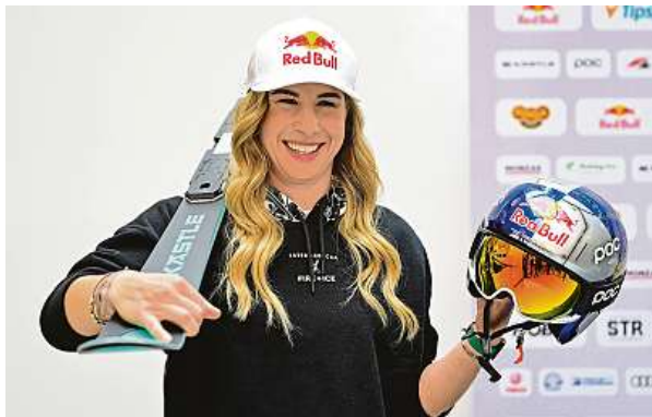
Trojnásobná olympijská šampionka Ester Ledecká se ve středu vrací z Itálie, kde byla na snowboardovém kempu.

Trojnásobná olympijská vítězka Ester Ledecká zahájí sezonu v listopadu novým sjezdem Světového poháru (SP) v Zermattu. Bude to její první závod na lyžích od března 2022. Dvakrát operovaná klíční kost, kvůli níž v minulé sezoně stihla jen pár snowboardových závodů, ji neomezuje. V minulé sezoně měla místo obvyklého nabitého závodního programu kalendářní dny zaplněné rehabilitací operované klíční kosti a kondičním tréninkem toho, co mohla posilovat. Přišla o MS v alpském lyžování i na snowboardu. Jediné závody absolvovala na konci sezony na prkně, v Rogle a Berchtesgadenu skončila druhá a třikrát první. Na lyžích nezávodila vůbec.