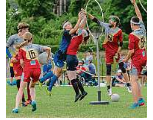
Hraje se se čtyřmi míči.

dání kamene mudrců. Zájemce čeká také scénické čtení z knih o slavném čaroději. Můžete se těšit na jídlo inspirované světem Harryho Pottera od Chutě pod Lampou. MET