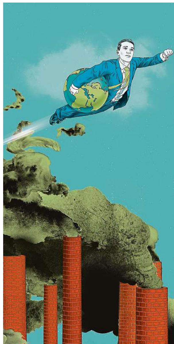
Každá firma a každý podnikatel se může stát superhrdinou a pomoci svým přístupem k záchraně planety.

Firmy se musí naučit být ve své komunikaci na poli udržitelnosti především transparentní, aby nesklouzly i nevědomě ke greenwashingu. Ten je definován jako klamání spotřebitele o ekologické prospěšnosti produktu, služby či celé firmy (viz box).