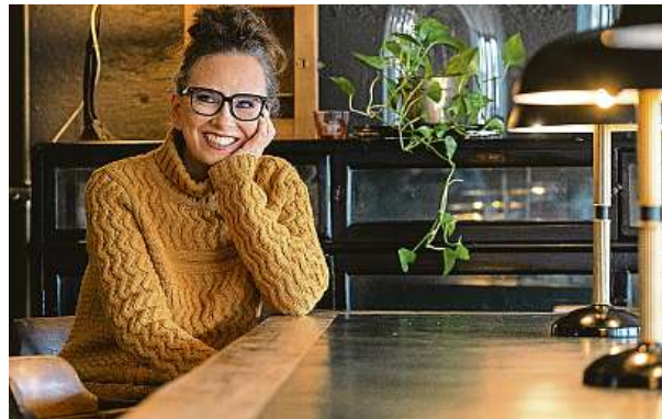
Yrsa Sigurdardóttir je islandské jméno, v němž Sigurdardóttir je patronymum, nikoli klasické příjmení. Je to proto jen Yrsa. GRADA

Muž má nádor na mozku a musí podstoupit náročnou operaci. Rozhodnou se s dětmi odejít někam, kde bude klid, a tak se odstěhují do Hvalfjördu. Vybrala jsem tuhle lokaci, protože jsem chtěla, aby místo bylo blízko Reykjavíku, ale zároveň hodně odlehle.