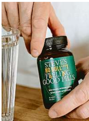
Jedno balení pilulek Steve's pořídíte do čtyř stovek. STEVE'S

Bylinné směsi ve formě pilulek jsou sice většinou stejně tak dobře vhodné i pro ženy. Tímto faktem si ale zástupci značky Steve's nenechávají zkazit svou výhradně na chlapy zaměřenou PR propagaci.