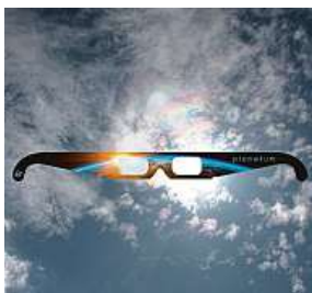
Na částečné zatmění slunce si pořídte brýle.

Částečné zatmění bude možné pozorovat z velké čas-