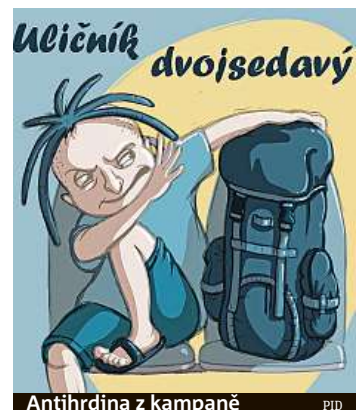
Antihrdina z kampaně