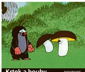
Krtek a houby