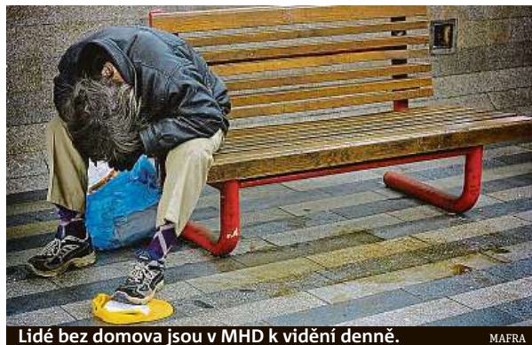
Lidé bez domova jsou v MHD k vidění denně.

Jednou z nich byla například aplikace s názvem Bob a Bobek, králíci z klobouku v MHD. „Tato kampaň, kterou je dopravní podnik nápomocen, upozorňuje cestující na tyto nešvary a jak by se měli v prostředcích MHD cho-