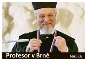
Profesor v Brně