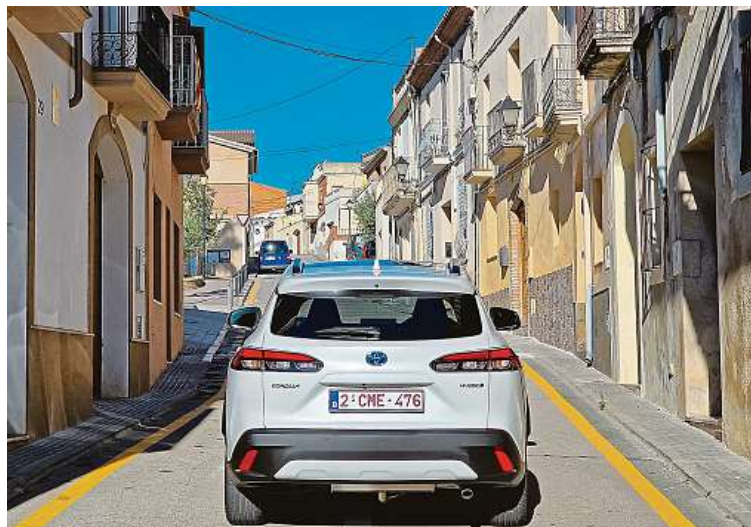
Zadní lampy mohly být větší, ale ctí designový jazyk automobilky.