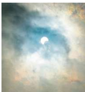
Částečné zatmění 2x KONEKTOR