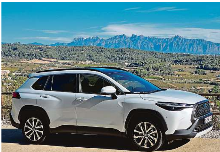
Katalánské silničky nabízejí lákavé svezení pro ty, co milují ostré zatáčky.