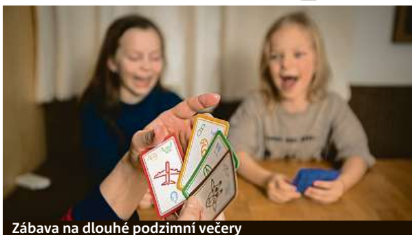
Zábava na dlouhé podzimní večery

„Před pěti lety jsme vydali první karty v divokých barvách s motivem lva. Tři roky