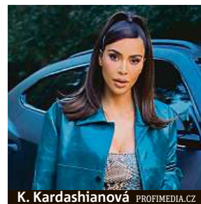
K. Kardashianová

Představitelé početné arménské diaspory, mezi něž se řadí i televizní hvězda Kim Kardashianová, si odříkají značné finanční obnosy, aby pomohli své domovině, kterou nyní zasáhl konflikt o Náhorní Karabach. Zatímco samotná Arménie má méně než tři miliony obyvatel, v zahraničí podle odhadů žije asi osm milionů etnických Arménů, píše agentura Reuters. Prostředky vybrané v nynějších sbírkách jdou na zajištění naléhavých potřeb, jako je zdravotnická pomoc či přístřeší. Arméni usazení v cizině ale posílají do vlasti nezabíratelné částky tradičně.