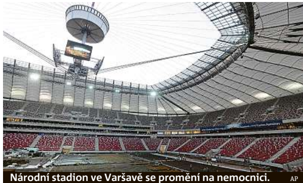
Národní stadion ve Varšavě se promění na nemocnici.

Náš jižní soused umožní od pátku scházet se jen šesti dospělým, venku nanejvýš dvanácti. Vicekancléř Werner Kogler řekl, že je situace vážná, a opět přitom poukázal na nepříznivý vývoj v Česku. V Rakousku za 24 hodin přibýlo 1121 potvrzených případů nákazy koronavirem. Nové opatření, které omezuje počet účastníků na soukromých akcích, se týká mimo jiné sva-