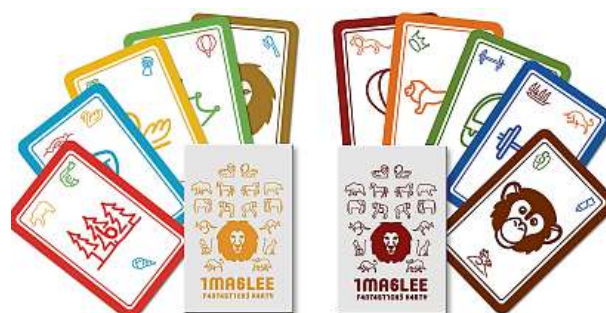
Karty rozvíjejí kreativitu.

Jednou si tak zahrávejte pexeso, jindy zase oblíbené