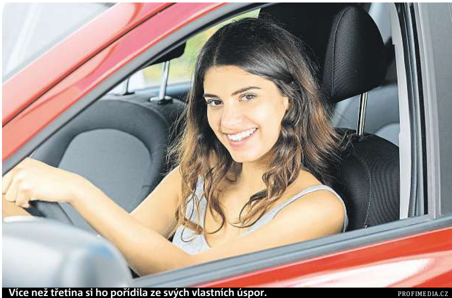
Více než třetina si ho pořídila ze svých vlastních úspor.

Každá šestá žena přitom rozhoduje o výběru auta sama a téměř třetina žen přiznává, že je při výběru vozu dokáže alespoň zčásti ovlivnit reklama. Průzkum také ukázal, že pětina žen by si