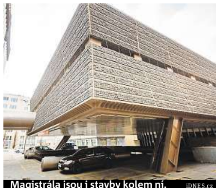
Magistrála jsou i stavby kolem ní.

„Jsem optimista. Opravdu věřím, že každý chce mít lepší město. Víím, že vždy budou nějaké problémy, ale říkají mi dánský ledborec,“ řekl.