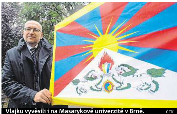
Vlajku vyvěsili i na Masarykově univerzitě v Brně.