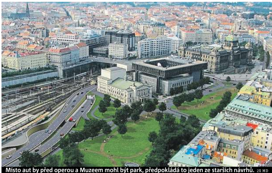
Místo aut by před operou a Muzeem mohl být park, předpokládá to jeden ze starších návrhů.

Hlavní město s Gehlem, jehož hlavním přístupem je navrácení měst lidem, uzavře smlouvu o konzultaci, zaplatí mu za to zhruba dva miliony korun. „Žádné řešení ještě nemám. Jsem jako domácí lékař, který se také přijde nejprve podívat, v jaké stavu pacient je, a až potom navrhne léčbu,“ vysvětlil Gehl. Jeho tým se nejprve bude muset seznámit s podklady, příští rok si sami udělají další průzkum. Gehl věří, že se jeho nápady podaří uskutečnit.