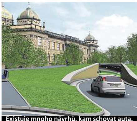
Existuje mnoho návrhů, kam schovat auta.