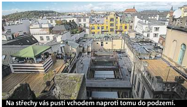
Na střechy vás pustí vchodem naproti tomu do podzemí.