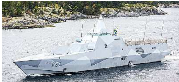
Švédská korveta Visby pátrá podél pobřeží.

Akci připomínající dobu studené války provádí švédská armáda poblíž Stockholmu.