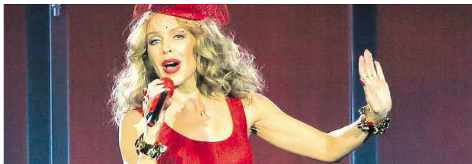
Kylie Minogue před měsícem v Londýně