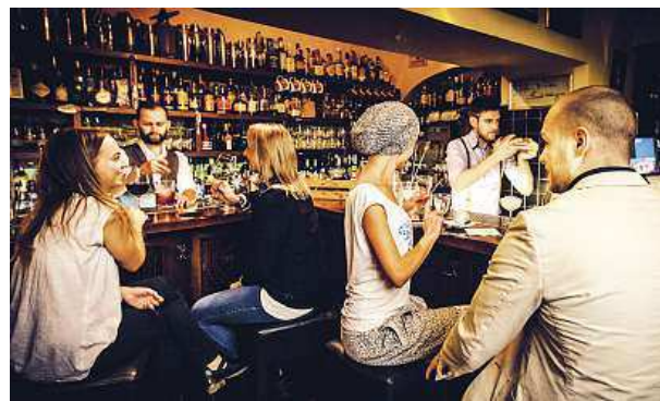
Bar, kam by Ernest Hemingway rád chodil.