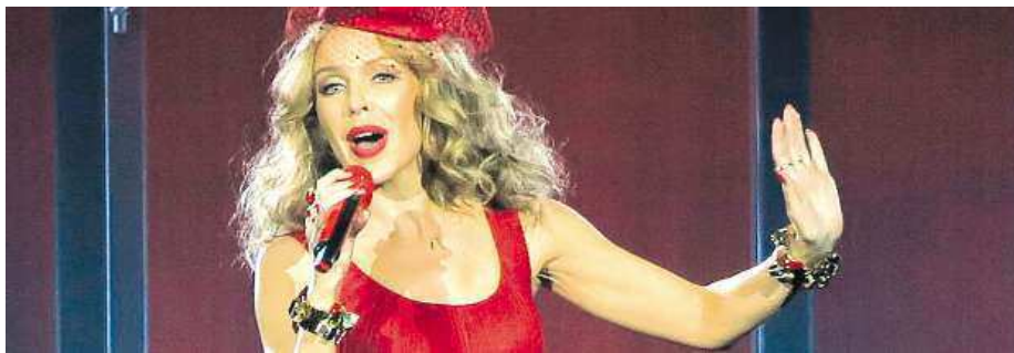
Kylie Minogue před měsícem v Londýně