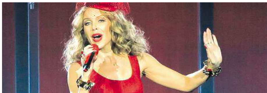
Kylie Minogue před měsícem v Londýně