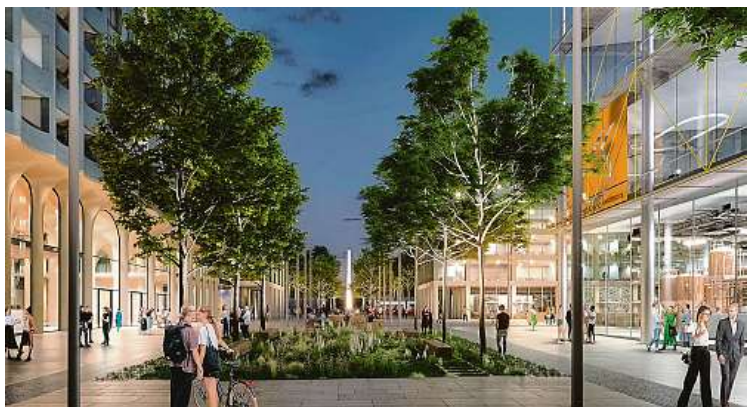
Vítězný návrh. Všechny soutěžní návrhy budou vystaveny v pražském CAMP.