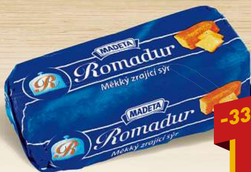
Romadur 100 g