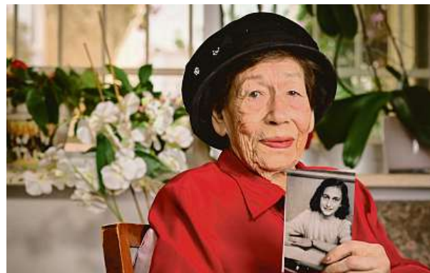
Hannin příběh přežití navzdory všemu je svědectvím o trvalé síle přátelství, lásky a paměti.