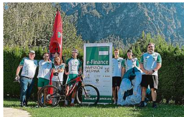
Letošní ročník, který proběhl v Dolomitech v tyrolském Lienzi, byl pozoruhodný také účastí českého týmu e-Finance Sport Team.