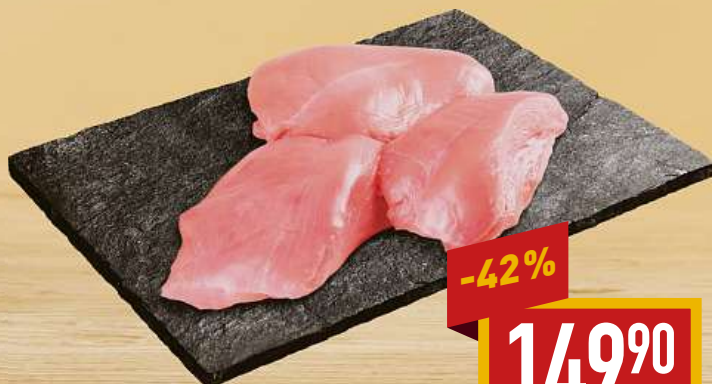
Krůtí prsa cena za 1 kg