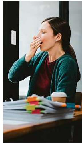
Nevýkonní zaměstnanci mohou demotivovat ostatní.

Sociální citění v určitých situacích by měl mít každý vedoucí pracovník. Pozor ale na to „falešné“, které si často šéfové a vedoucí týmu pletou se soucitem. „Ve většině případů je za tím schovaný strach z nepříjemného řešení situace. Neexistuje šéf, kterému by dělalo dobře, když má někoho z firmy poslat pryč. S podvědomou výmluvou, že to dělám pro dobro druhého, se lépe žije. Zadělavá si tím