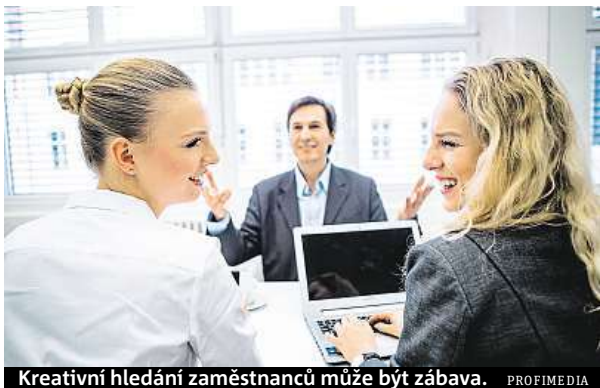
Kreativní hledání zaměstnanců může být zábava.

Klíčový je inzerát. Jednou z možností je vytvořit všeobecný inzerát, který bude začínat třeba slovy „Chci pracovat v...“ a dosadíte si jméno své firmy. Nemusíte se zaměřovat přímo na danou pozici. „Zmíňte pozice, které jsou momentálně otevřené, ale také povzbudte ty, kteří ideální pozici nenašli, aby se také přihlásili,“ radí Lucie Spáčilová, trenérka seminářů na téma najímání a hodnocení zaměstnanců a výkonná ředi-