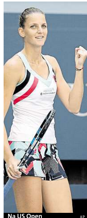
Na US Open

„Teď je mým hlavním cílem kvalifikovat se na Turnaj