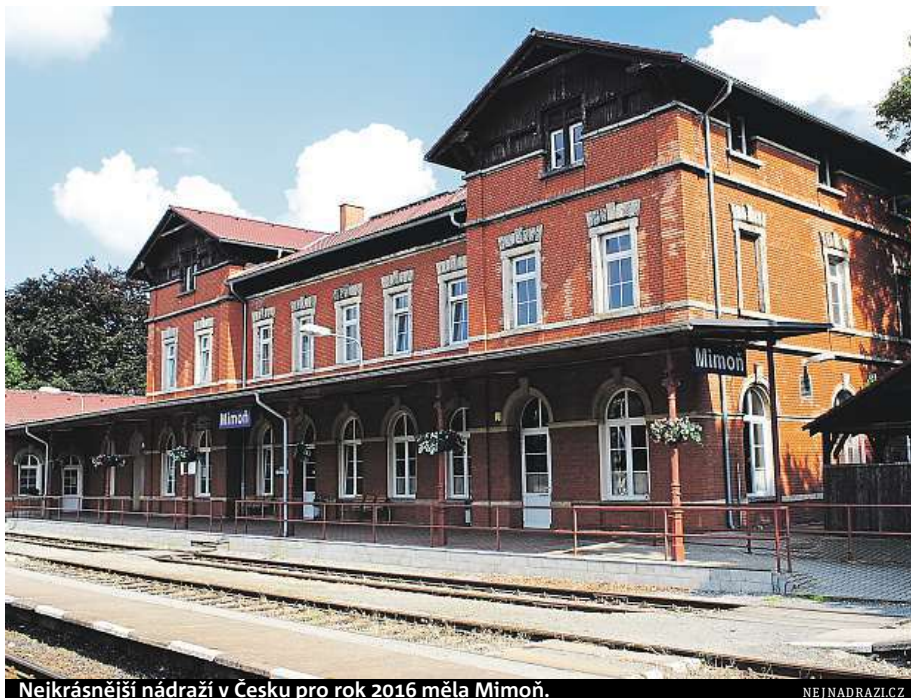
Nejkrásnější nádraží v Česku pro rok 2016 měla Mimon.