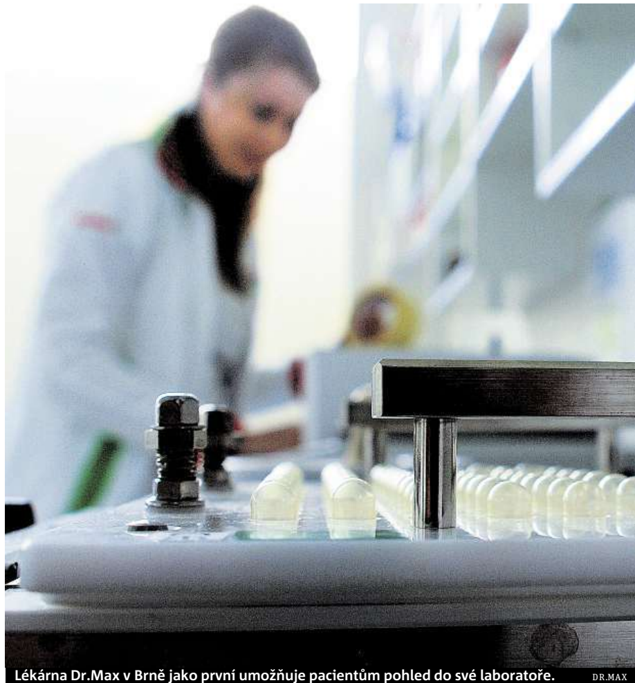
Lékárna Dr.Max v Brně jako první umožňuje pacientům pohled do své laboratoře.

Brněnská laboratoř v nových prostorách areálu brněnského BB Parku představuje víc než třicetmiliónovou investici. Využívá plochy asi 350 metrů a zahrnuje veškeré vybavení potřebné k individuální přípravě. „Zatím z Brna zásobujeme individuálně připravenými léky jen