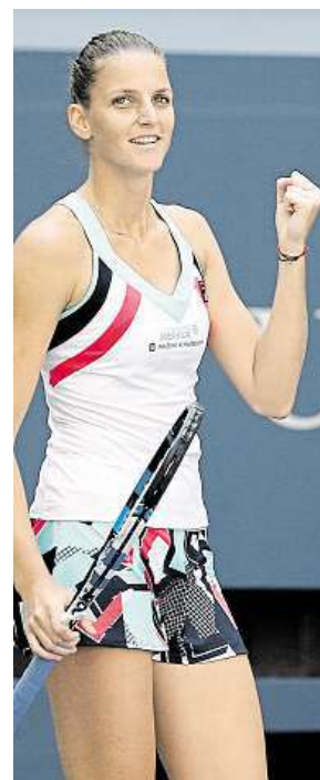
Na US Open

„Teď je mým hlavním cílem kvalifikovat se na Turnaj