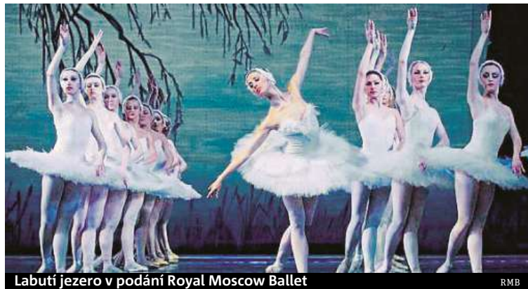
Labutí jezero v podání Royal Moscow Ballet

Do Česka přijede soubor z velkého turné po Spojených státech amerických, kam na podzim tohoto roku vyrazí. HOP