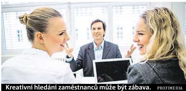
Kreativní hledání zaměstnanců může být zábava.

Hra i široké síť. To vám pomůže snadno najít dobré zájemce do firmy.