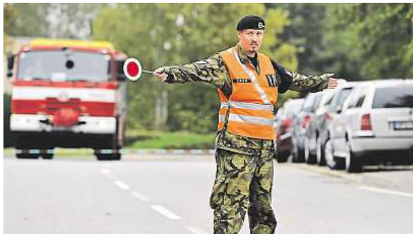
Armáda kvůli explozi uzavřela okolí akademie.